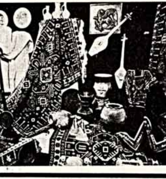
Интерьер одного из залов.

В канун Нового года в доме № 42 на Арбате состоялось новоселье. Здесь будет жить культурный центр Грузинской ССР.