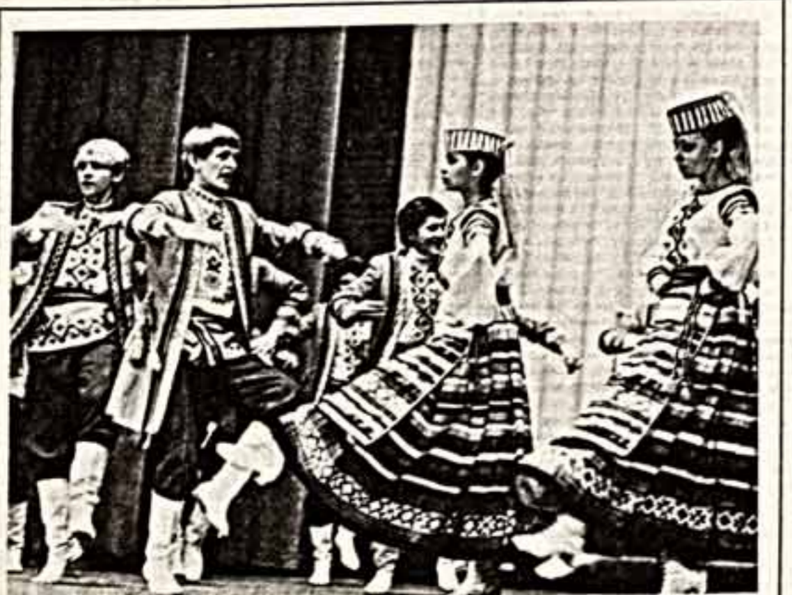
Центр формирования эстетического вкуса и воспитания у молодежи любви к народной культуре стал Брестский дворец культуры профсоюз. Народный ансамбль песни и танца «Брестчанка», студия балетного танца и клуб самодеятельной песни, в танце «Молодые художественные коллективы участвуют во дворце». Выступает танцевальный ансамбль «Брестчанка».

Вячеслав БАСКОВ. МОСКВА — КОСТРОМА — ЧУЛОМА — МОСКВА.