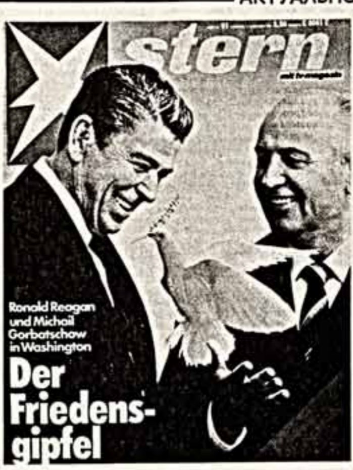
Ronald Reagan and Mikhail Gorbachev in Washington. Der Friedensgipfel.