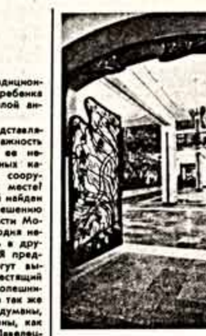
На Арбате — новоселье

В канун Нового года в доме № 42 на Арбате состоялось новоселье. Здесь будет жить культурный центр Грузинской ССР.