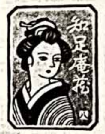
Штампельный вид экслибриса широко распространен в стране до сих пор. Оригинальные художественные книжные знаки появились только в середине XIX века и принадлежали в основном иностранным дипломатам и миссионерам. Развитие собственно японского

вый японский экслибрис датирован 1470 годом. Это штампель с иероглифической надписью: «Кража этой книги закроет тебе ворота на небеса, похищение ее — развратит врата ада. Любо, кто возьмет книгу без разрешения, будет наказан всеми богами Японии».