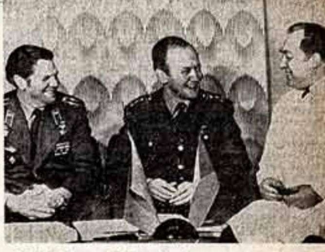
А. Губарев и В. Ремек беседуют после полета с врачом А. Дворжаком (ЧССР).

Проведение международных космических полетов является конкретным воплощением курса XXV съезда КПСС на всемерное расширение и углубление экономического и научно-технического сотрудничества с братскими социалистическими странами.