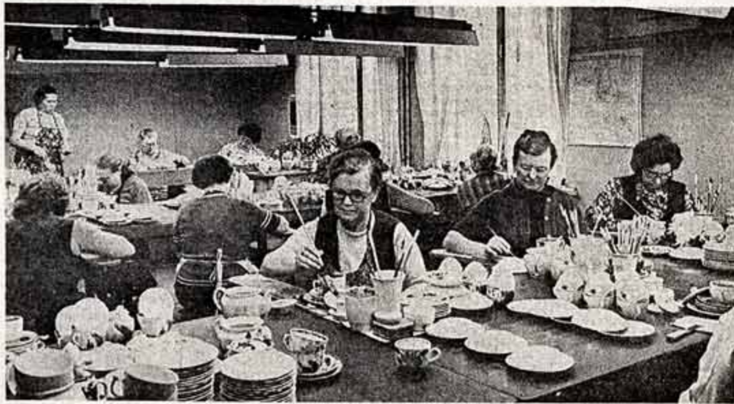
Одному из старейших в стране Дмитровскому фарфоровому заводу более двухсот лет. На предприятии, которое выпускает много чайной и кофейной посуды, полостью завершена реконструкция производственных зданий, и рудничный завод выпускает продукцию ввозе в два раза.

Берегите книгу. Книга — ваш верный друг.