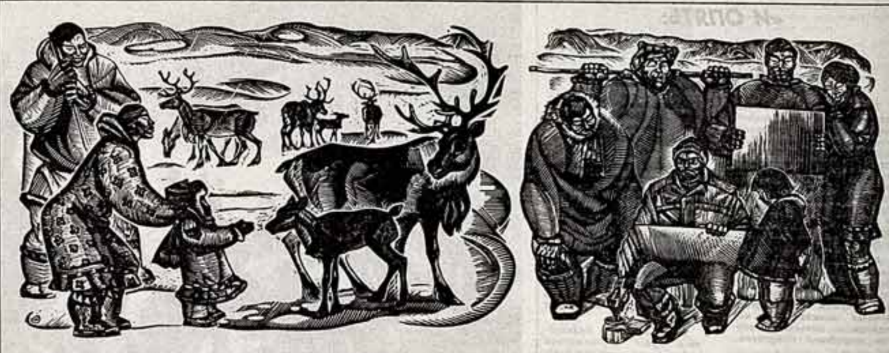
Работы Владимира Истомина, члена Союза художников СССР, на Андырьнеземельно посвящаем людям Севера: геологам и оленеводам, кусторам и рыбакам, авиаторам, строителям, морякам. Художник широкого творческого диапазона, знающий и любящий Чукотку, работает много и плодотворно. Его графические листы, живописные картины, плакаты, книжные иллюстрации к прозаическим писателям Севера можно встретить и в отдаленных уголках тундры, и на самых представительных художественных выставках.