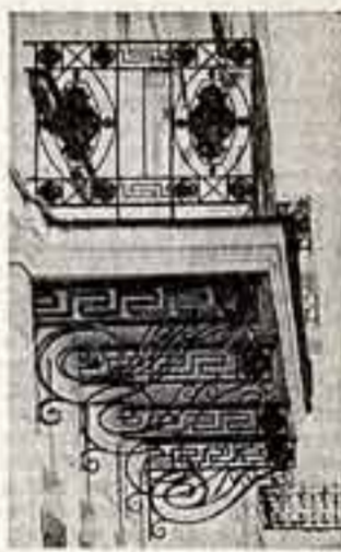
Старый Арбат — отреставрированный и обновленный архитектурный ансамбль — объявлен заповедной, пешеходной зоной.