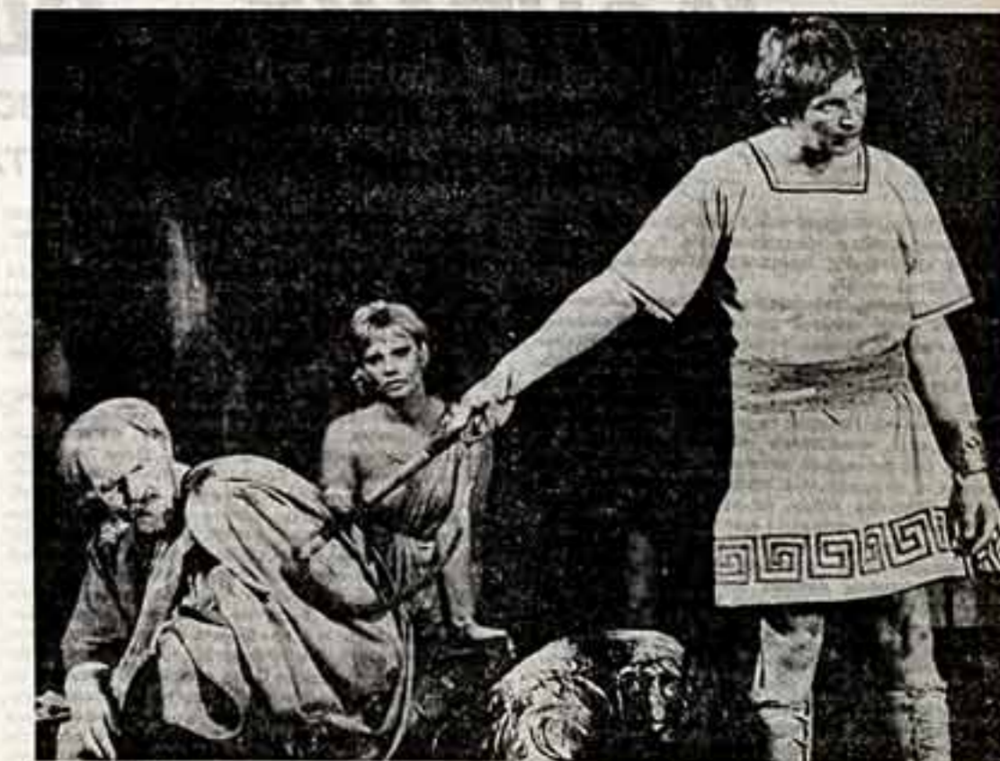
Свой 132-й сезон Красноармейский театр драмы имени А. С. Пушкина продолжил гастролями по Дальнему Востоку.