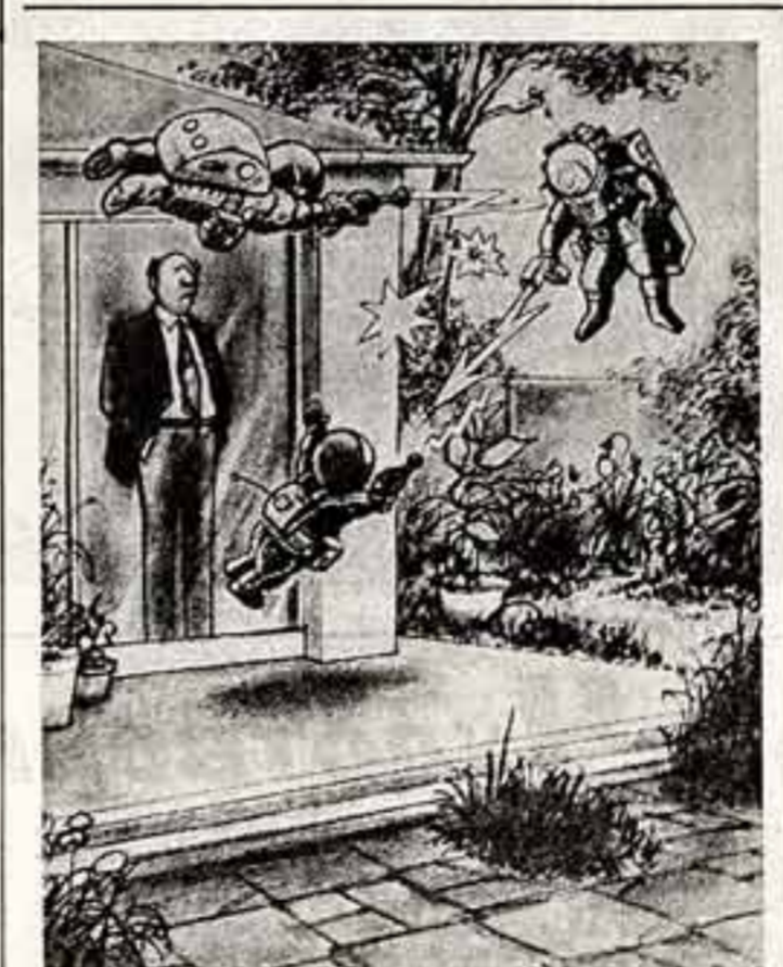
Конечно, в детстве, играя в войска, мы тоже не ждали шалаша. Но «зеленые войны» в собственном доме — это уже слишком!

Около 25 лагерей для подготовки террористов действует примерно в десятке