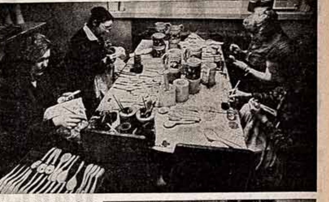
По всей Коми республике собирают художники образцы народного творчества, создают из них новые сувениры, художественные подарки. Это резьба и роспись по дереву и по бересте, аппликация из меха, вязание, резьба по кости. Занимается этим большим и важным делом экспериментальное предприятие народных промыслов.