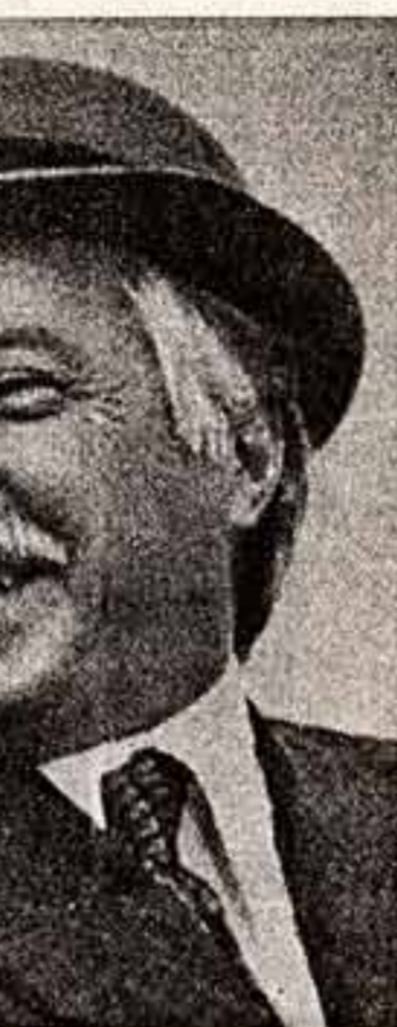
Лус Корвалан освобожден.