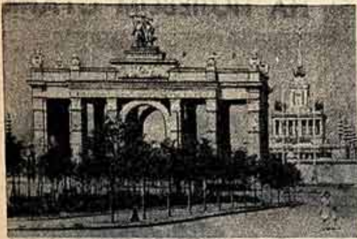
В конце лета в Москве откроется Всесоюзная сельскохозяйственная выставка. На снимках: слева — главный вход выставки; справа — павильон «Центральные области».