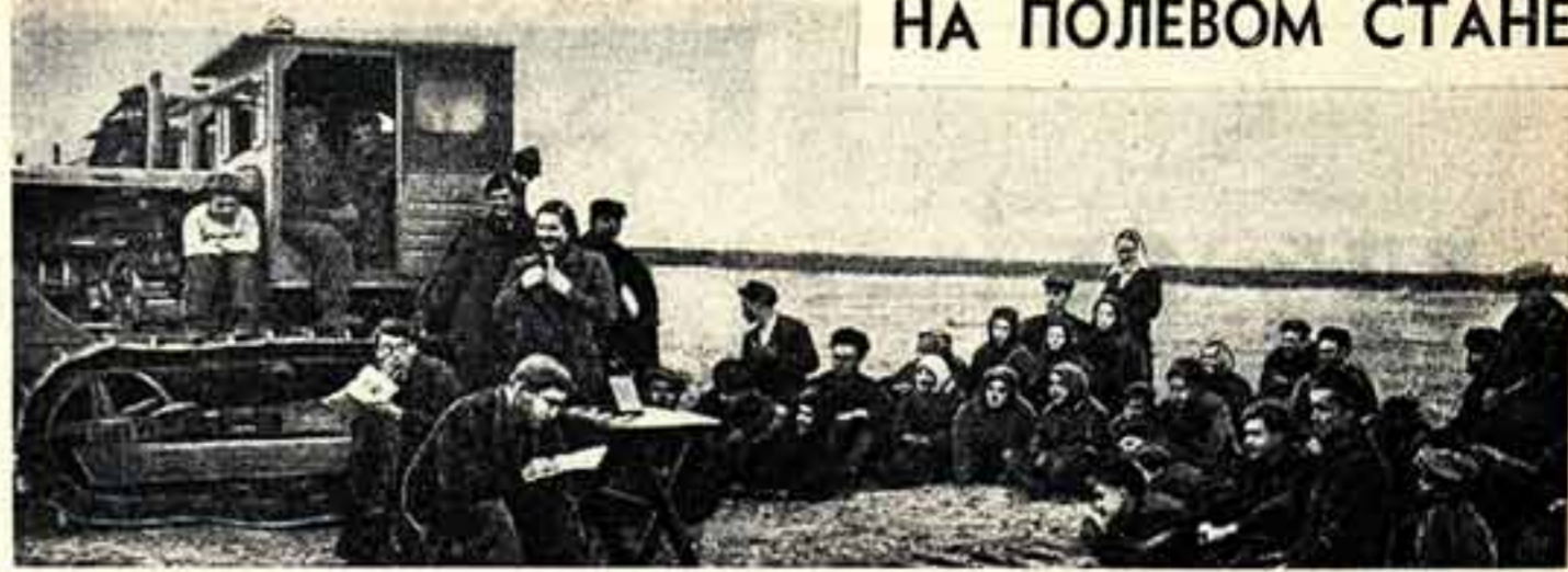
В обеденный перерыв агитационно-художественная бригада показывает трактористам инсценировку рассказа А. П. Чехова «На даче».

На полях Алтая создано четыре тысячи тракторных и полеводческих бригад. Сюда с первых же дней весенних полевых работ была перенесена деятельность большинства клубов, библиотек, кинопередвижек, лекторских групп. Совместно с партийными организациями МТС и колхозов работников культуры-просветителей оборудовали тракторные вагончики, украсили их плакатами, снабдили литературой, музыкальными инструментами. В полевые бригады было направлено около четырех тысяч библиотечных передвижек.