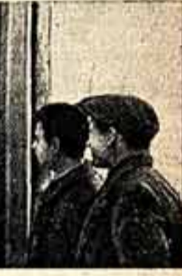
«Противу!» Возник Жуков допущает большие потери зерна. «Колхозка» метко бьет браконьеров.