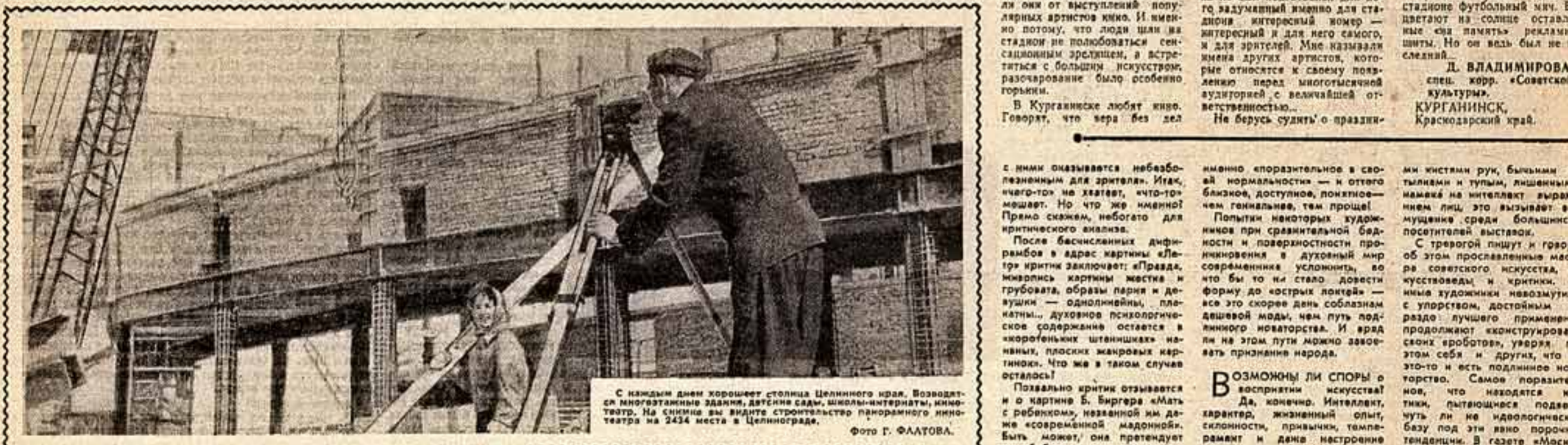
С каждым днем хорошеет столица Целинного края. Возводятся многочисленные здания, дается театр. На снимке вы видите строительство паркового кинотеатра на 2434 места в Целинограде.

Вместо того чтобы принимать «копированные» произведения, возникающие из-за недостатка мастерства, незрелости, критиканам полезно было бы сказать авторам правду.