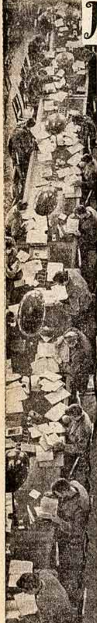
В общем читальном зале Библиотеки имени В. И. Ленина.

Типография газеты «Гудок», Москва, ул. Станкевича, 7. Зав. № 1335.