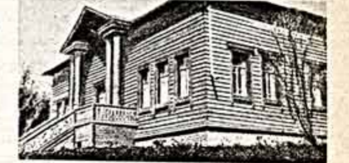
Дом Островских в Щелькове.