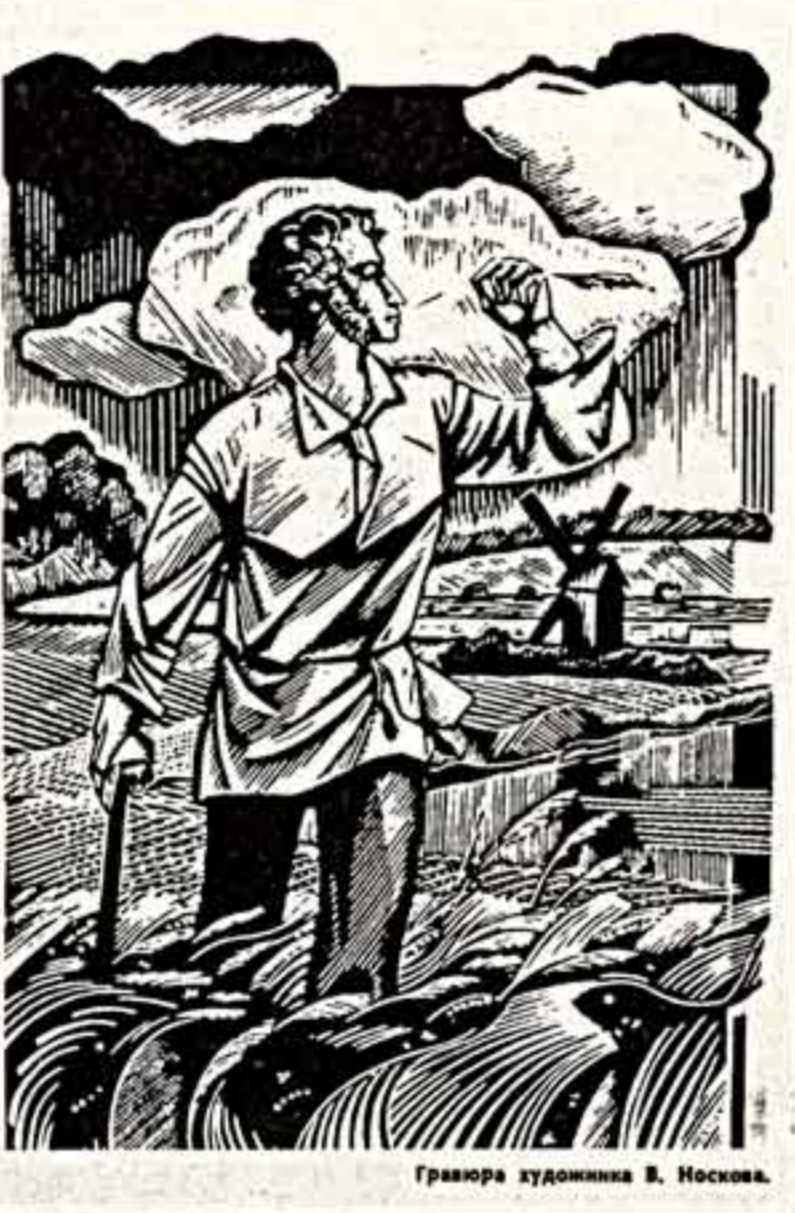
Гравюра художника В. Носкова.

Каждое место, где бывал Пушкин, — для нас святая. Становятся святынями и места, где бывали его близкие, останавливались друзья, жваили знакомые