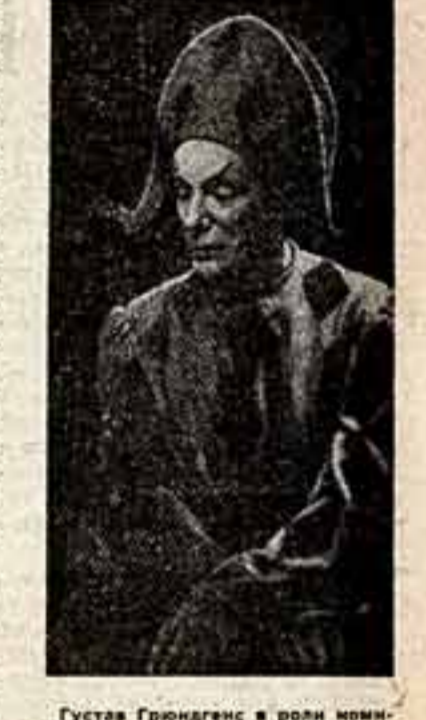
Густав Грюндгенс в роли именинного актера в пьесе «Фауст».

В Москве театр покажет «Фауста» Гете (первую часть) в постановке Грюндгенса, отрывок из трагедии Шиллера «Смерть Валленштейна» (режиссер Ульрих Эрфурт) и «Разбитый кушан» Клейста, поставленный