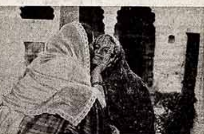
Кадр из фильма «Горный воздух».

дожестивший фильм бомбейского режиссера М. С. Сатхья.