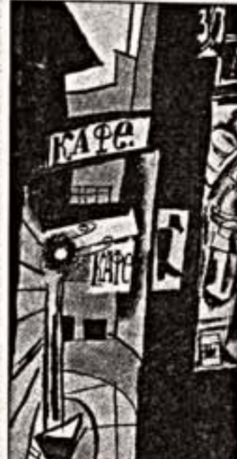
И.Пуля. "Кафе", 1910 г.