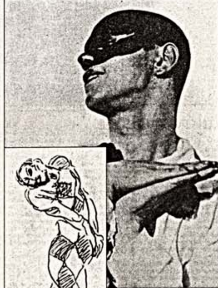
Слева: В.Нижинский - Альберт в балете "Жизель". Справа: В.Нижинский - Арлекин в балете "Карнавал". В центре: В.Нижинский. Рисунок А.Бурдела

Когда мы с Полом Коком расположились в одном из залов фестивального комплекса в самом центре Роттердама, австралиец небезно вынул трубку, нахмыл табачку из юкста и закурил, благо, Нидерланды еще не коопулась таланная американская напасть под названием по атокий. Беспробудно мы на следующий день после европейской премьеры его фильма "Дневники Вацлава Нижинского", от которого я пришел в восторг и сразу же попорнил мастро по интересу. Кока я знал по фильмам лет двадцать, он - один из столпов австралийского кино, художник тонкой, артистичной и романтизированной манеры. Слово, европеец до мозга костей. Он и есть европеец. Пол Кока родился в Голландии, в городе Венло, в 1940 году. 20-летним парнем сбегал от родителей в далекую Австралию, где и прожил большую часть жизни. Начал как фотограф. В его фильмографии так и документируются - как иро-фильм "Судья Сердце" (Lonely Heart, 1981), "Цветочный человек" (Man of Flowers, 1983), "Винсент"