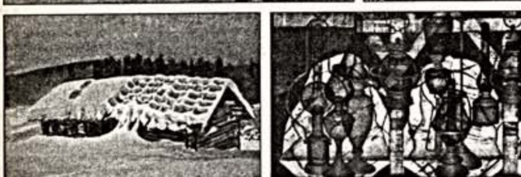
Верху справа: В. Калинин "Сидящая". Внизу слева: В.Харлов "Зима". Внизу справа: Б.Мессерер "Большой натюрморт с корсакиными лампами"