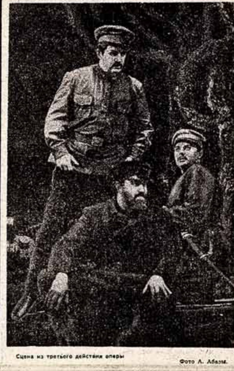
Сцена из третьего действия оперы «Семья Котков».