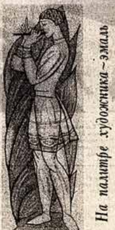
На палитре художника — эмаль

Итак, клубов в колхозе нет и пока не предвидится. Есть здание, приятно теплое и уютное. А теперь давайте представим вот что. Вдруг это был бы клуб, а не клуб? Ясно, как день: народный контроль и десятки выех контролеров минуты не потеряли бы простоя техники, за которую платили бы. А раз платили, значит, должны вернуться с прибылью — чего проще.