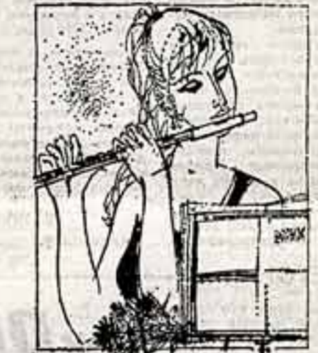
Рисунок Освальда Клаппера из газеты «Руде право».

Новый год будет отмечен новыми концертами, сонатинками, славлениями, сегодняшняя же ночь, ее люди, ее достижения, ее юбилей — 40-летие освобождения Советской Армией.