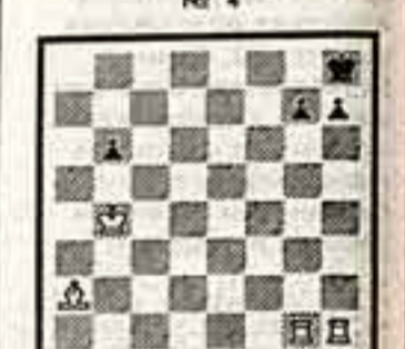
Мат в 3 хода

Автор задачи составил ее с небольшой изюминкой. В чем состоит его задумка? Как правильно оформить решение задачи и этюда? — такой вопрос встречается в ряде задач. В задачах вступительный ход — «жюль» к решению. Из требований художественности вытекает, что первый ход, как правило, «жюль» очевиден: шах или просек, взятие тут неизбежны.