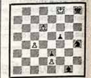
Выиграет А. ГУЛЯЕВ № 4