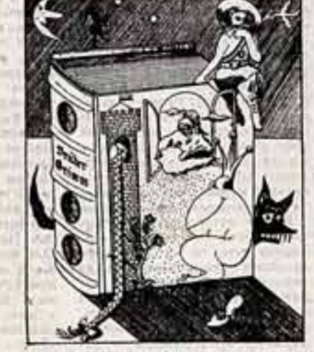
Популярные герои сказок братьев Гримм. Коллаж из еженедельника «Возмездие» (ГДР).