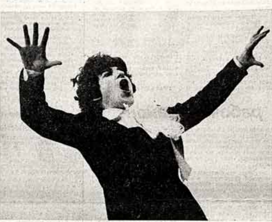
М. ТОРЧИНСКИЙ, спец. корр. «Советской культуры», ДНЕПРОПЕТРОВСК.