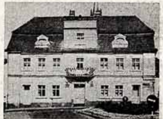
Дом-музей фельдмаршала М. И. Кутузова.