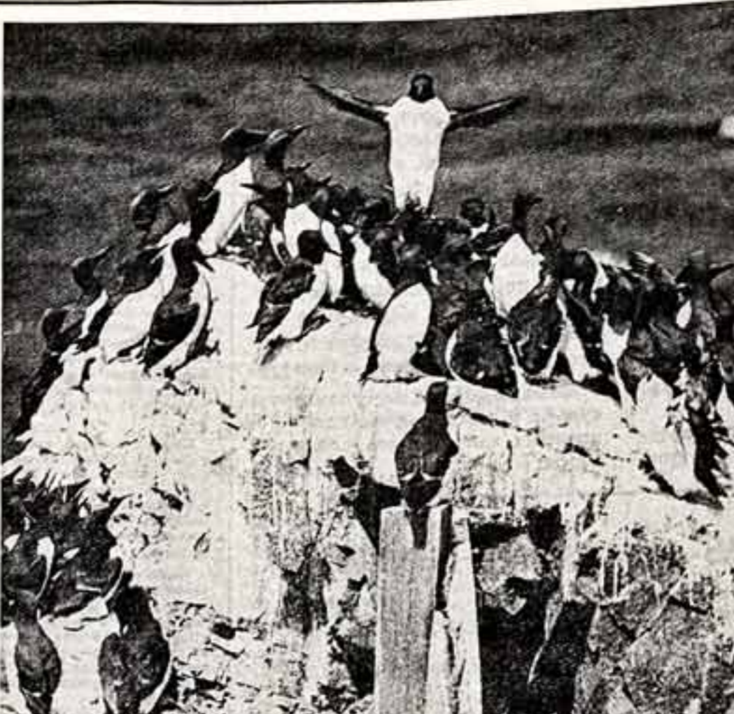
ФОТОКУРС В. САЧЕК. «Дирижер». Л. ГРУБИНСКАЯ. «Последний аккорд».

М. ТОРЧИНСКИЙ, спец. корр. «Советской культуры», ДНЕПРОПЕТРОВСК.