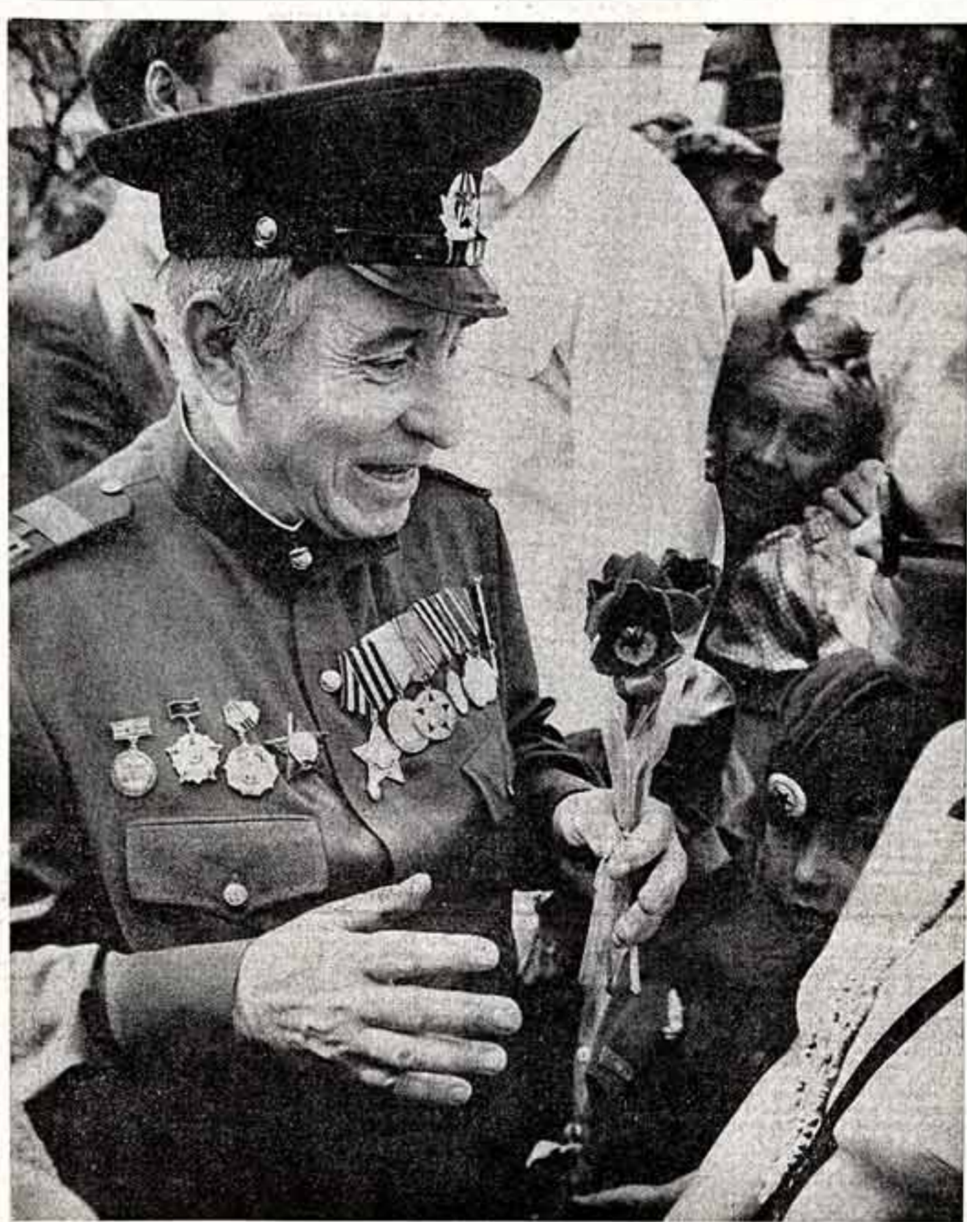
Вот и прибавилось сорок лет к молодости солдата.

Начинается год празднования Великой Победы, и выходит на торжество все те нечеловеческие, прославленные и безвестные, кто шел путями войны, кто с нее не вернулся.