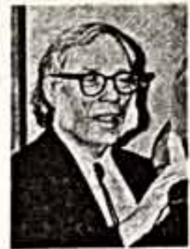
Айзек Азимов, писатель (США):

— Главным политическим событием 1988 года считаю визит М. С. Горбачева в США и его речь в ООН, в которой он заявил о своем намерении сократить количество вооруженных сил и вооружений в Восточной Европе. Это заявление еще раз подтвердило его искреннее стремление к миру. Надеюсь, Соединенные Штаты не замедлят с соответствующим ответом.