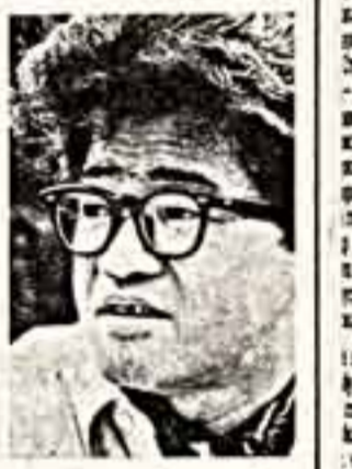
Кобо Абэ, писатель (Япония):

— Самое важное событие уходящего года... Признаться, назвать какое-то одно, конкретное не могу. Но хочу сказать: до последнего времени, в особенности до этого года, от всего происходящего в мире не было тяжело. По сути мы жили в обстановке «холодной войны». И вот только сейчас, к концу 1988-го, наступил настоящий отлетел. Свершилось то, от чего и я, и мир, и душа забрежж свет.