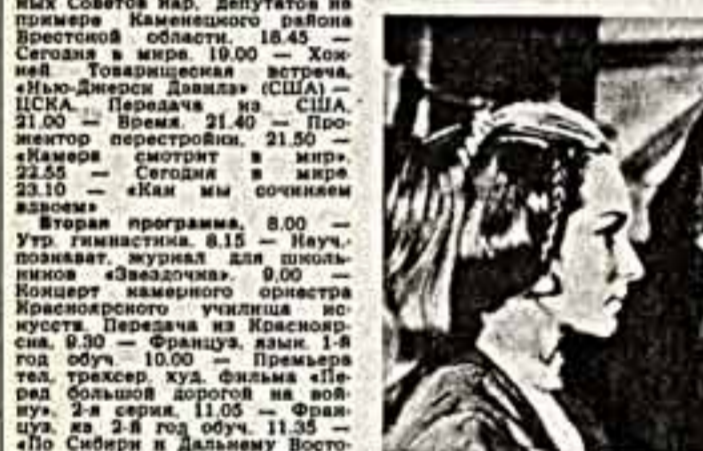
Смотрите премьеру телевизионного художественного фильма для детей «Перед большой дорогой на войну», «Убежище», 1987 г.