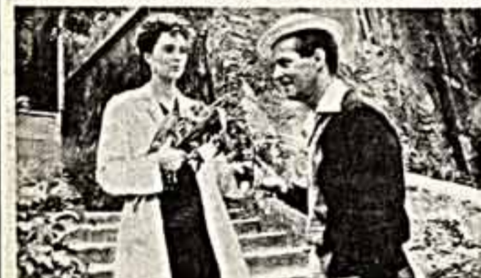
Смотрите премьеру телевизионного художественного фильма для детей «Перед большой дорогой на войну», «Убежище», 1987 г.