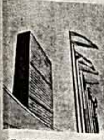
«Не страшней никогда, чем земной колокол; он зовет по тебе...» Джон ДОНН.