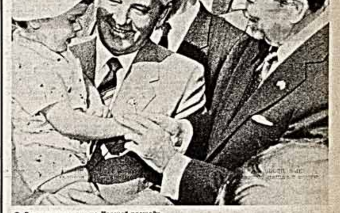
Во время прогулки по Красной площади.

Б. ЮНАНОВ. Общая из эпизодов Советско-Индийского фестиваля.