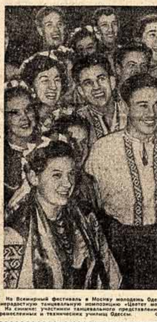
На Всемирном фестивале в Москве молодые Одессы привезли много интересных танцевальных композиций «Цветы молодости» Украинины. На снимке: участницы танцевального представления — воспитанницы ремесленных и технических училищ Одессы.