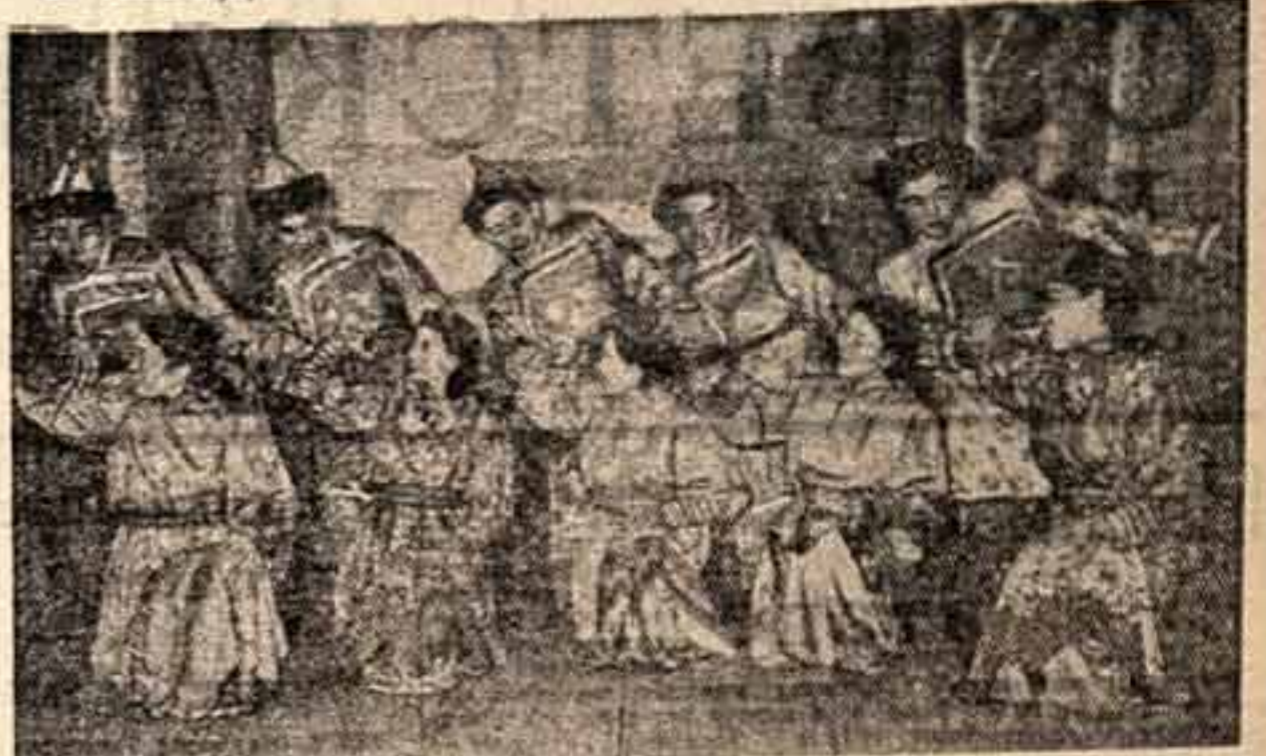
С каждым годом повышается интерес к культурной жизни колхозников. Давно уже отменили в прошлом Указом Верховного Совета СССР от 1936 года о запрете на посещение театров, концертов и выставок. В настоящее время культурная жизнь колхозников стала развиваться в широких масштабах. В этом году в строительстве колхоза более миллиона рублей.