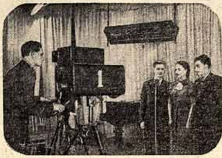
Перед телекамерой Горьковского любительского телецентра выступают участники самодеятельности трудовых резервов.