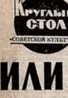
«КРУГЛЫЙ СТОЛ» «СОВЕТСКОЙ КУЛЬТУРЫ»