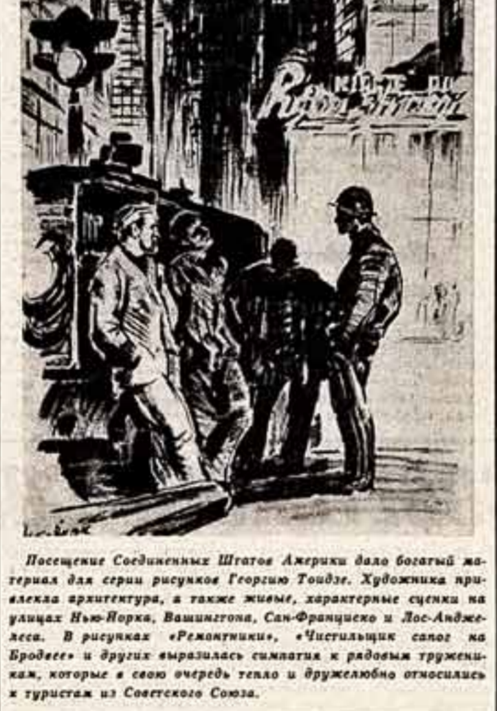
Посещение Соединенных Штатов Америки дало богатый материал для серии рисунков Георгию Тондзе. Художника привлекала архитектура, а также живые, характерные сценки на улицах Нью-Йорка, Вашингтона, Сан-Франциско и Лос-Анджелеса.