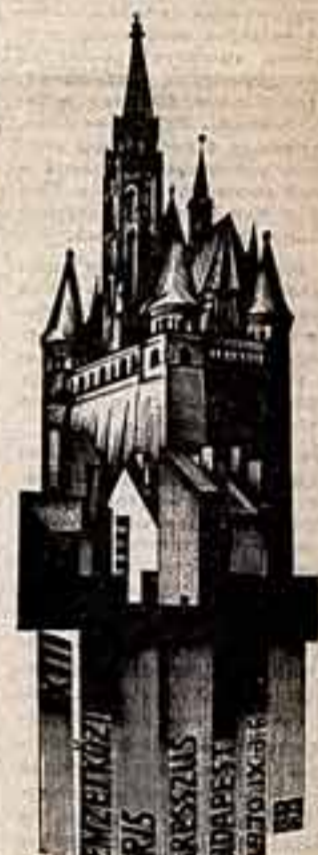
Книжный знак XIII Международного конгресса экслибрисистов в Будапеште.