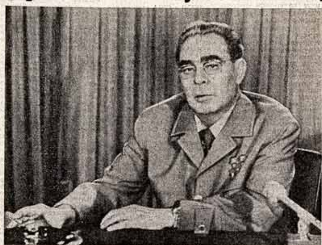
США, 24 июня. Генеральный секретарь ЦК КПСС Л. И. Брежнев выступил по американскому телевидению.

Уважаемые американские граждане! Я высоко ценю эту возможность обратиться к вам посредством телевидения непосредственно к народу Соединенных Штатов Америки во время своего визита в вашу страну.