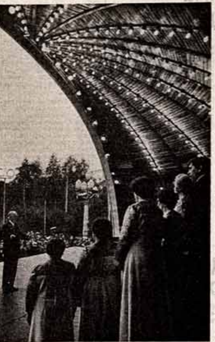
Бережовым просекая этого парка посещают сотни любителей...