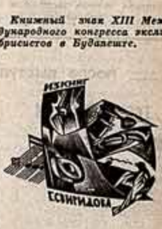
Книжный знак Г. Сеиридова.