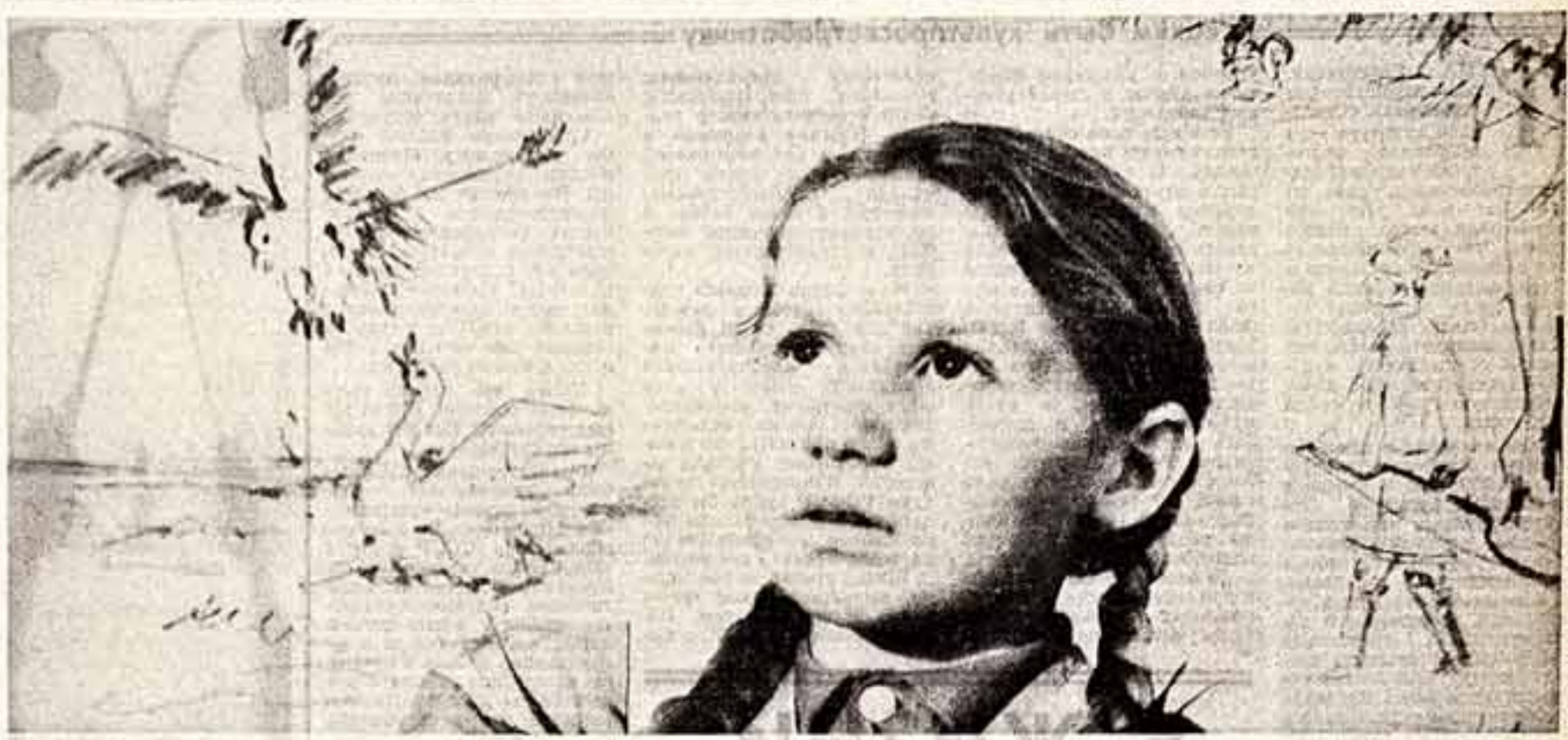
Комната, сплошь заставленная мольбертами... Включен проигрыватель — народный артист СССР Игорь Ильинский читает «Сказку о царь Салтане». Два десятка мальчишек и девочек увлеченно рисуют. Образы, навеянные музыкой пушкинских стихов, сияют под рукой юных художников. Идет один из уроков в детской художественной школе лодосмского города Пушкино.

Школа существует пятый год. В прошлом году был первый выпуск. Сейчас занятия посещают почти три тысячи школьников города и района — ученики пятых-десятых классов.