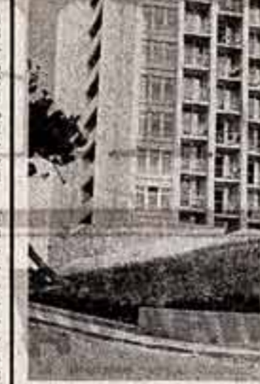
В живописном поселке Дивногорское Краснодарского края расположился дом отдыха для родителей с детьми «Голубая даль»; новый 8-этажный корпус с благоустроенными залами, в зимнее время работает бассейн с морской водой.

В феврале от перрона новосибирского вокзала отошел необычный поезд — «Искусство». Среди его семидесяти пассажиров были художники, актеры, музыканты, писатели, участники самодеятельности. Только в одном Искитимском районе они побывали с концертами, выставками, партией в организационных союзах и трех колхозах. Двадцать шесть концертов и встреч, шесть тысяч зрителей — та