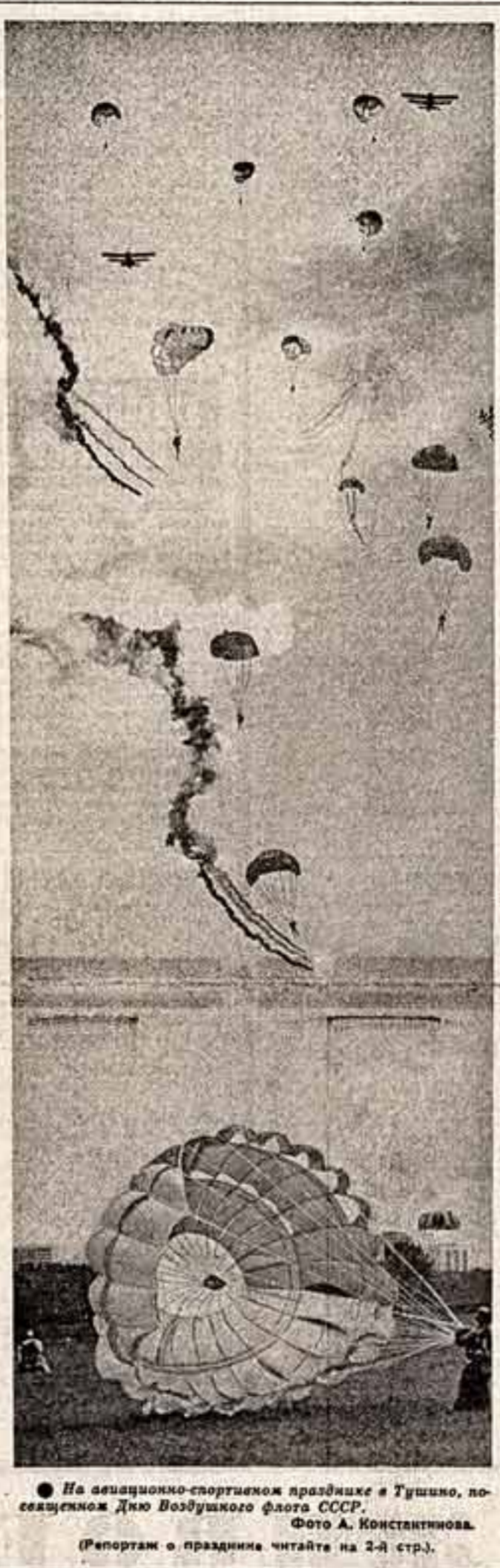
На авиационно-спортивном празднике в Тушино, посвященном Дню Воздушного флота СССР. (Репортаж о празднике читайте на 2-й стр.)

Политбюро ЦК КПСС приняло ряд постановлений по конкретным вопросам, в которых определяются практические меры по реализации договоренностей, достигнутых в ходе дружеских встреч товарища Л. И. Брежнева с руководителями братских партий и государства.