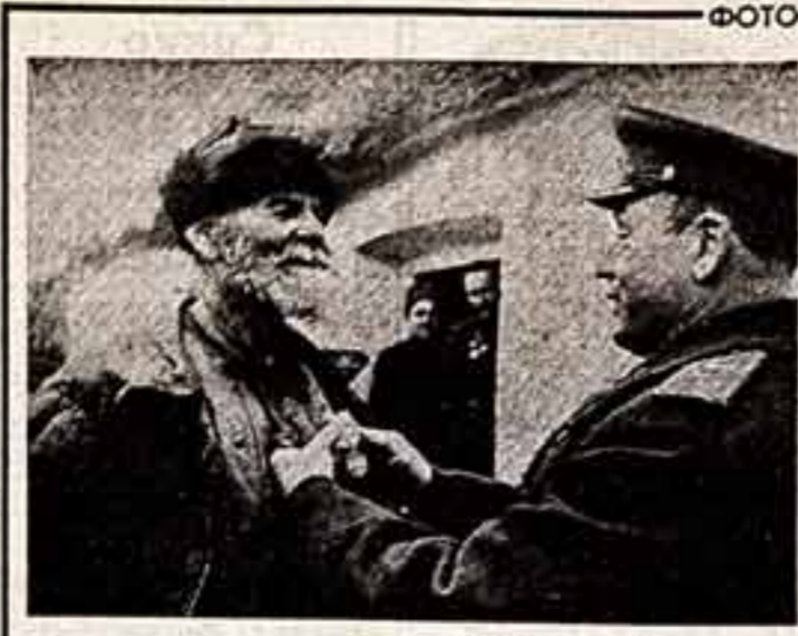
Впервые Георгий Зельма взял в руки фотоаппарат...