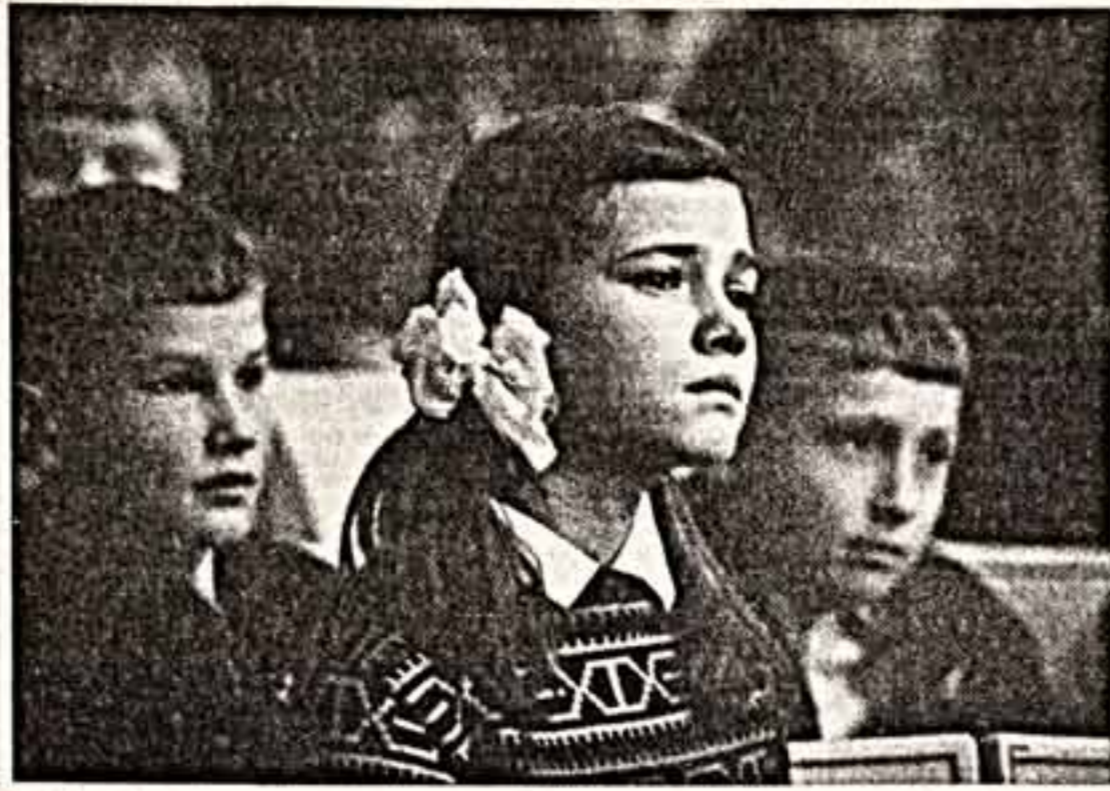
Спектаклем «Между небом и землей жаворонок вытаскал» открыл свой 68-й сезон Академический центральный детский театр...