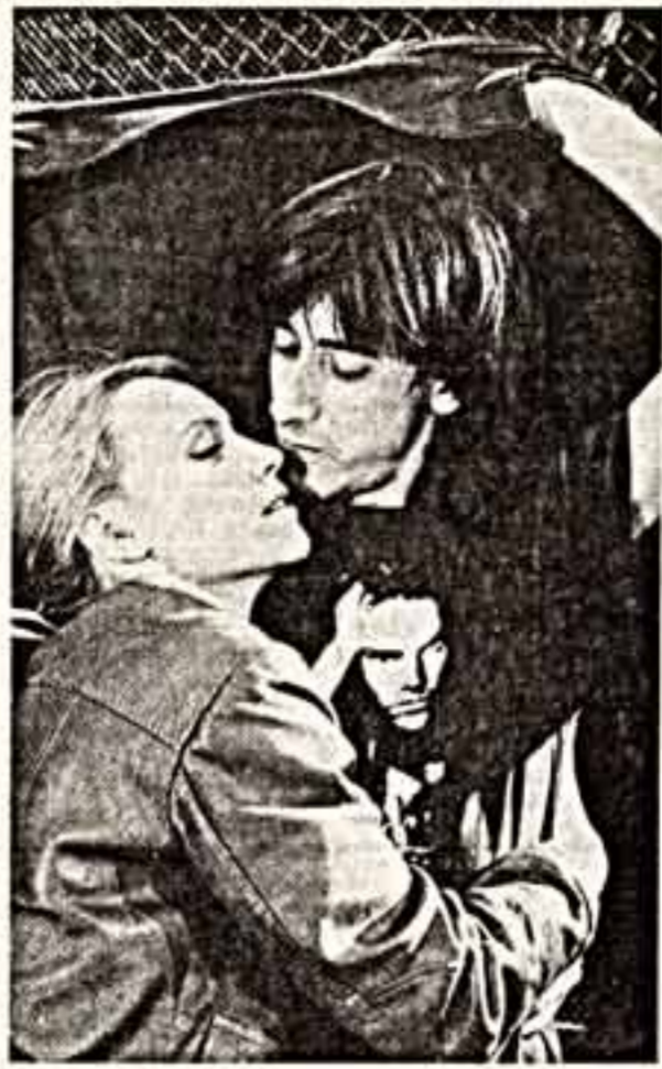
Сцена из спектакля «Между небом и землей жаворонок вытаскал» Ю. Шекочихина...