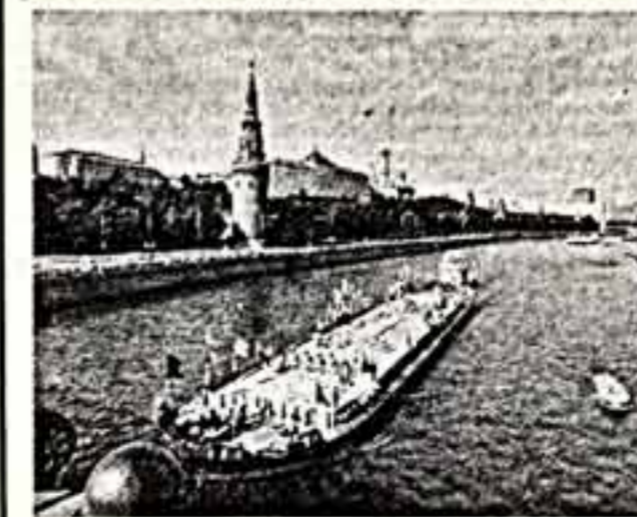
«Праздником души, который будет длиться целый год» назвала Фестиваль Индии в СССР Премьер-министр Индия Р. Ганди. Яркой, запоминающейся кульминацией первого дня этого Фестиваля стало гала-представление индийских артистов, показанное на Большой спортивной арене Центрального стадиона имени В. И. Ленина в Лужниках.