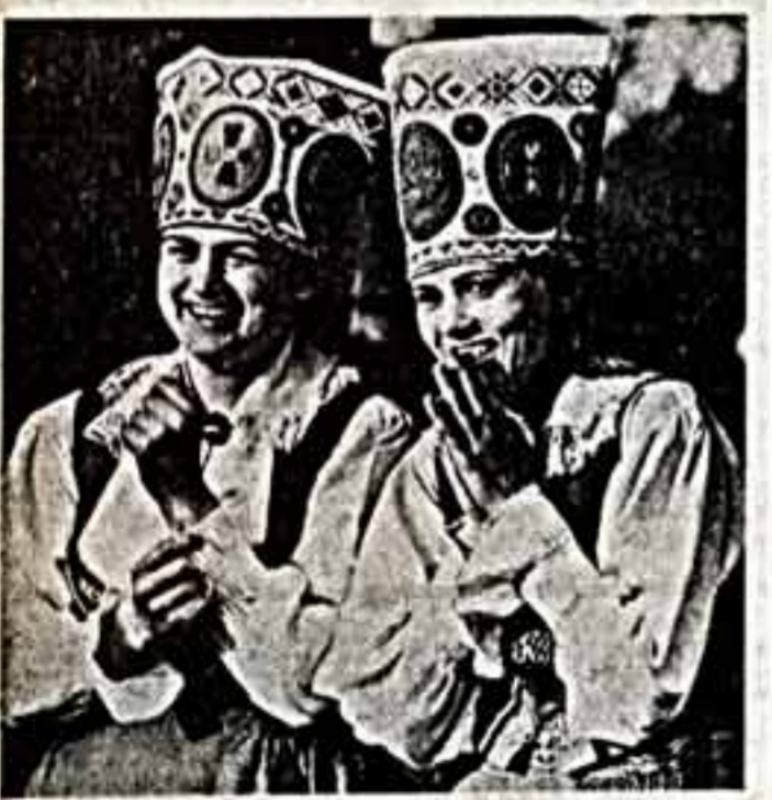
Все в этот день говорили о том, что на острове Сааремаа... Музыкальный привет...