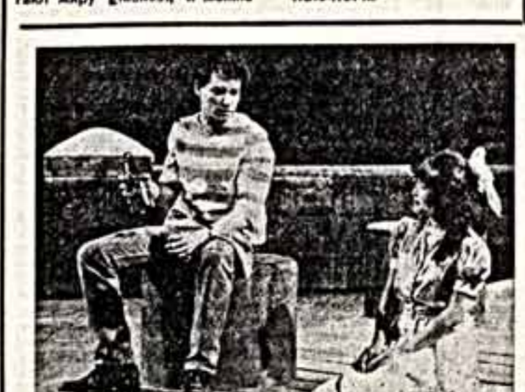
Сцена из спектакля «36, ты, здравствуй!» в постановке театра «Стейдж уан» в Лусквилле.

Александр АВДЕЕНКО. (Спец. корр. «Советской культуры».)