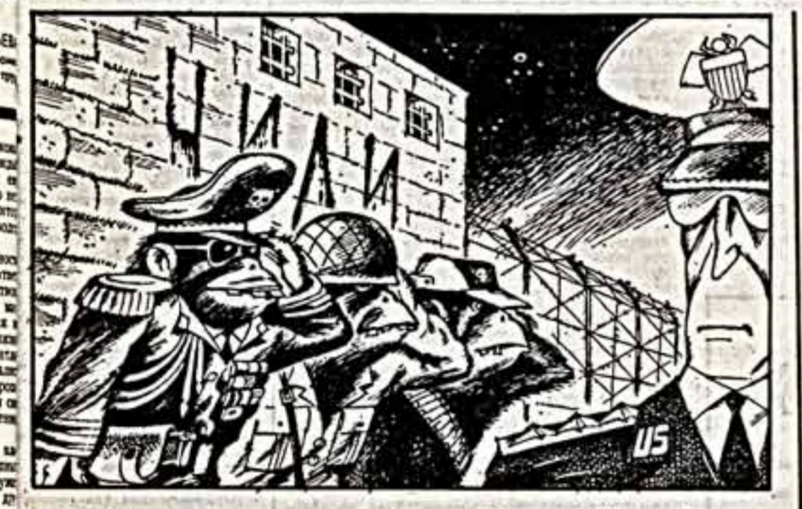
На кого рождается злота. Рисунок В. Уборевича-Боросского.