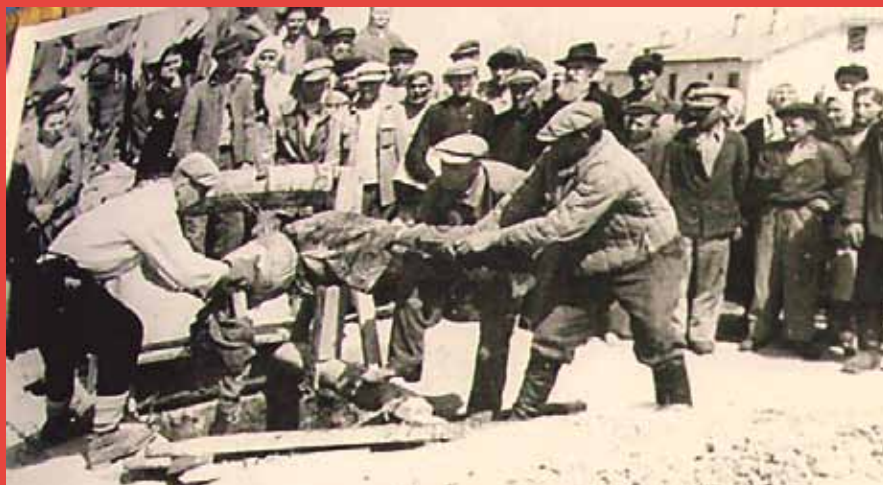
Извлечение останков из колодцев в селе Дубки