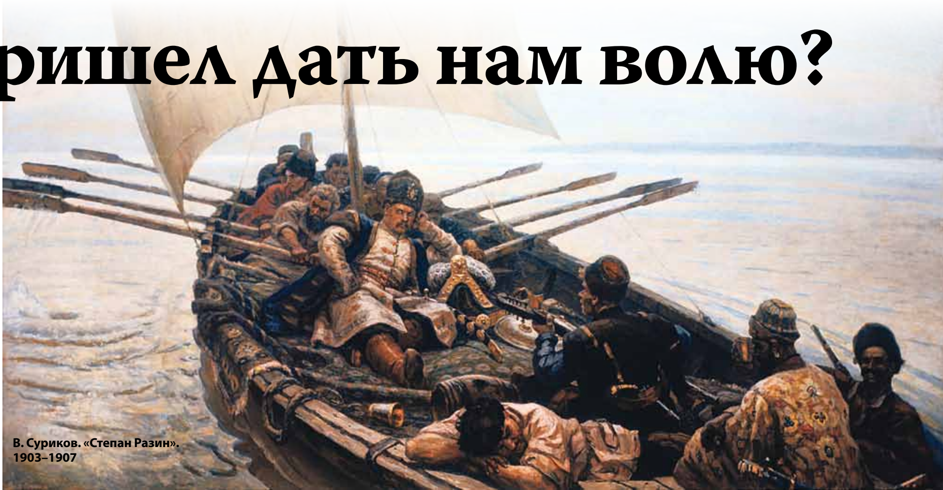
В. Суриков. «Степан Разин», 1903–1907

Степан сын Тимофеев родился в 1630 году, а первые упоминания о нем в хрониках относятся к 1667-му, когда начался знаменитый Персидский поход. В него он вступил уже авторитетным и очень опытным военачальником,