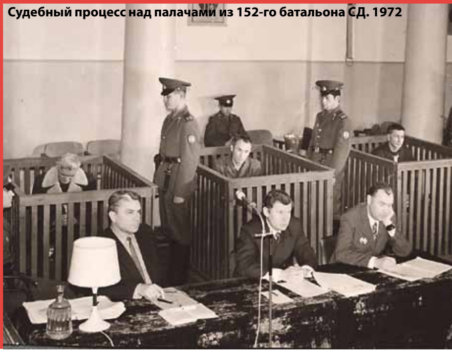
Судебный процесс над палачами из 152-го батальона СД. 1972