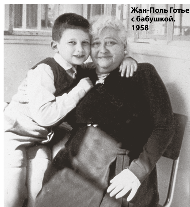
Жан-Поль Готье с бабушкой. 1958

В 18 лет Готье был принят на работу к самому Пьеру Кардену, который сразу оценил его исключительное дарование. Но юноше не терпелось пойти своим путем. Поэтому вскоре Жан-Поль облачился в тельняшку (она и поньше остается закройеру приходилось довольствоваться тем, что было под рукой. Платье он шил из салфеток, а бижутерию сооружал из чайных ситечек и батареек. Для дефиле модельер выбирал самые неожиданные места — бо-