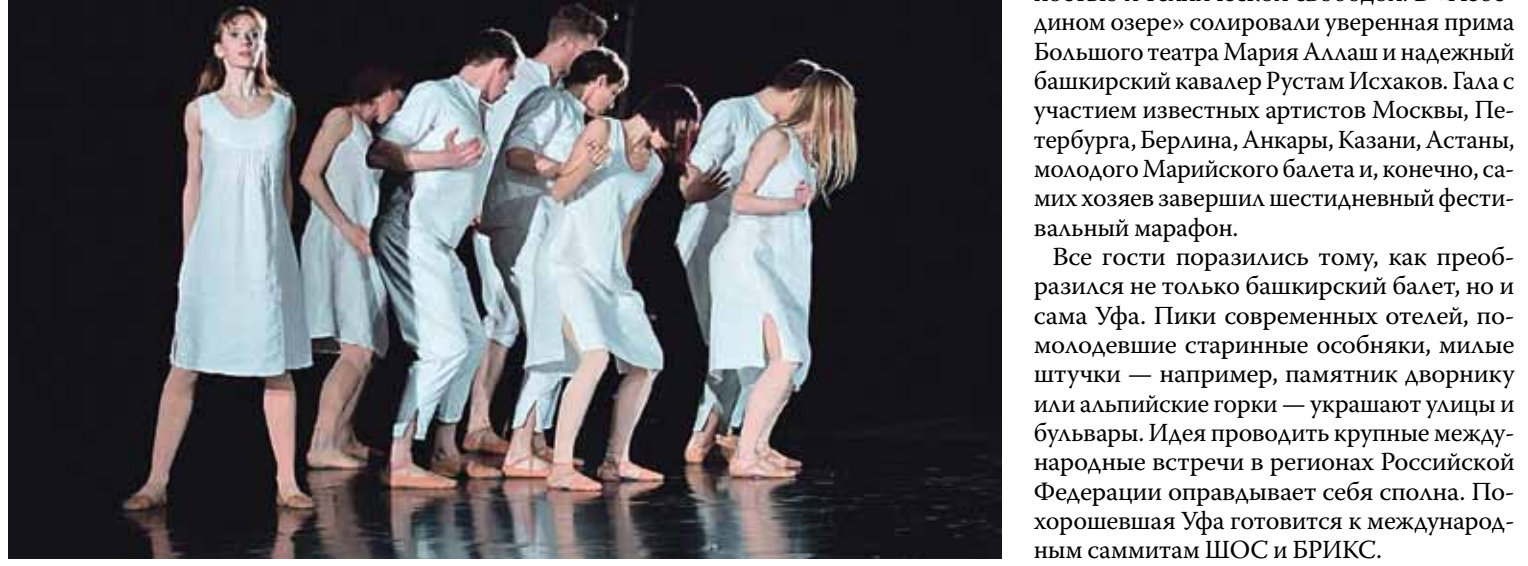
«Письма с фронта»

Архиповский: Оно было самое нераспространенное (смеется). Но так получилось. Говорят, родителей не выбирают. Так вот — инструмент тоже. Поначалу комплексовал из-за балаалайки. Начал более или менее нормально себя ощущать, когда гитаристы и скрипачи стали жалеть мне руку после концертов.