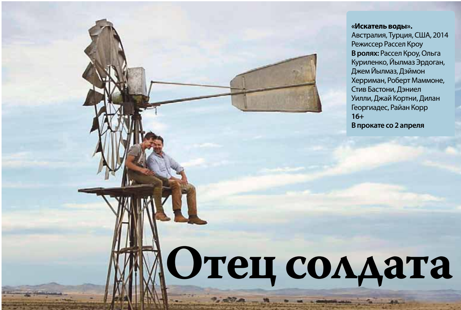
«Искатель воды». Австралия, Турция, США, 2014 Режиссер Рассел Кроу В ролях: Рассел Кроу, Ольга Куриленко, Йылмаз Эрдоган, Джем Йылмаз, Дэймон Херриман, Роберт Маммон, Стив Бастони, Дэниел Уилли, Джэй Кортни, Дилан Георгиадес, Райан Корр 16+ В прокате со 2 апреля