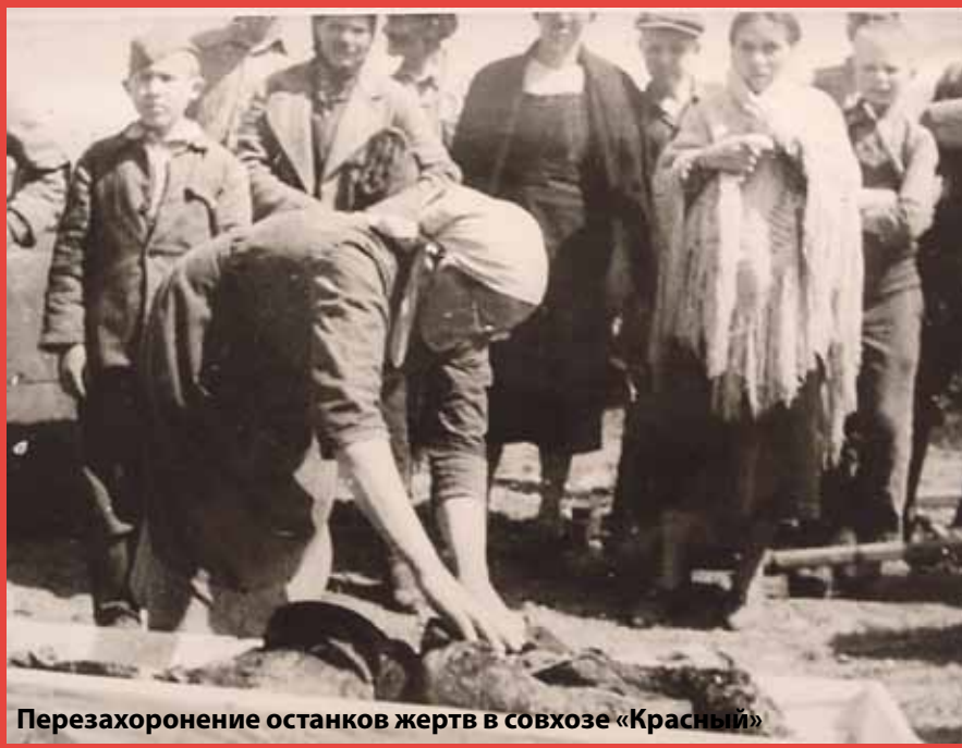
Перезахоронение останков жертв в совхозе «Красный»