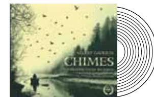
Valery Gavrilin «Chimes» Мелодия

Валерий Гаврилин вошел в историю музыки в 1960-х с вокальным циклом «Русская тетрадь», став одним из ярчайших представителей так называемой «новой фольклорной волны» — наряду с Георгием Свиридовым, Родионом Щедриным, Сергеем Слонимским. Основное место в творчестве Гаврилина отведено сочинениям для главного музыкального инструмента всех времен — голоса. Свое творческое кредо композитор определял так: «Инструменты будут приходить и уходить, стареть и отмирать. Но никогда не исчезнет человеческий голос... Вокальная музыка — кратчайший путь до души человека».