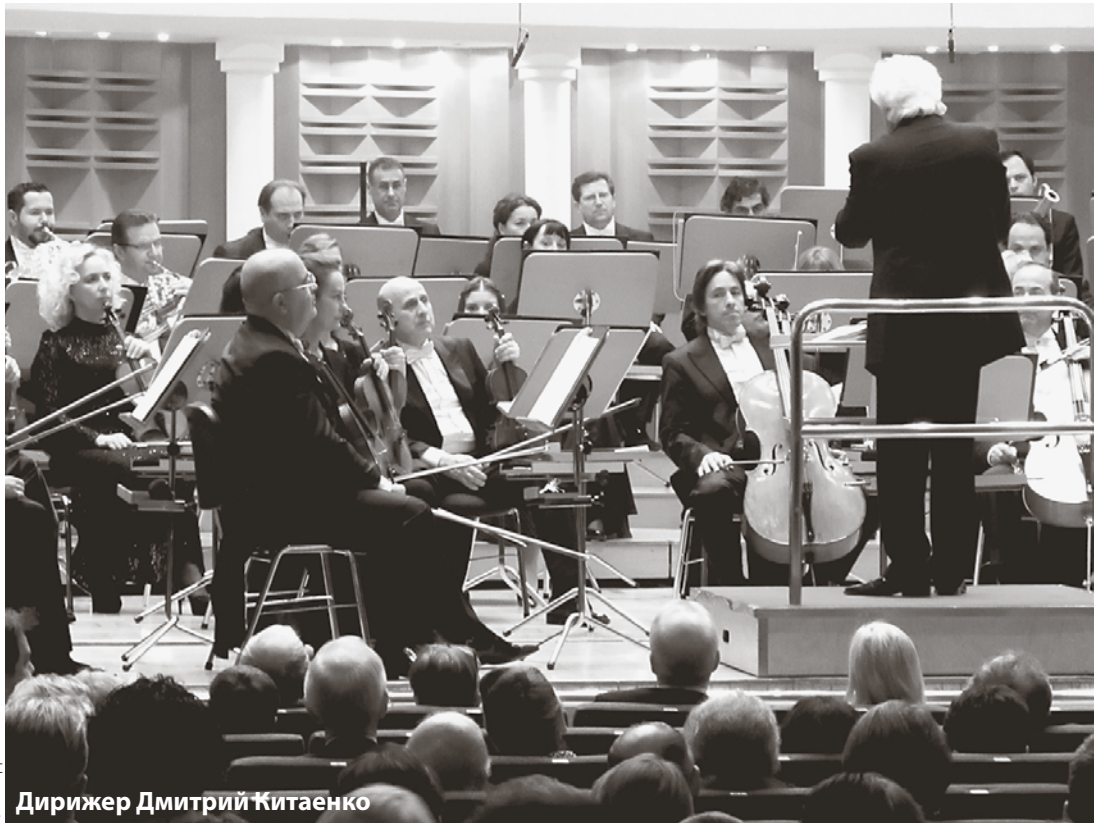
Дирижер Дмитрий Китаенко