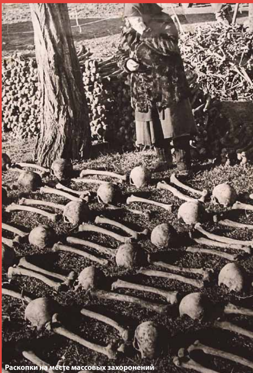
Раскопки на месте массовых захоронений