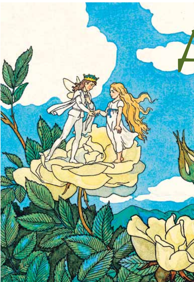
РИСОВОК Е. ЛЕХТЕРЕВА