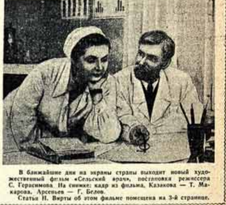
В ближайшие дни на экраны страны выйдет новый художественный фильм «Сельский врач»...