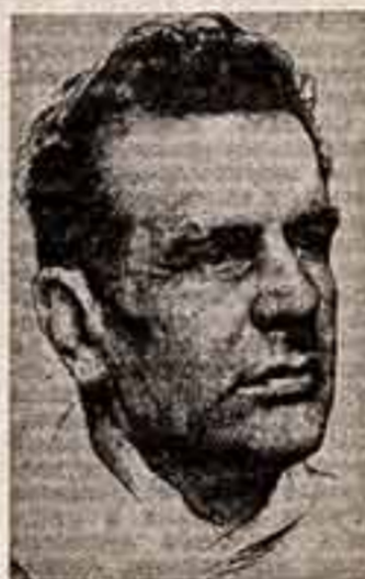
Работая в кубинской столице, в период коллективизации...