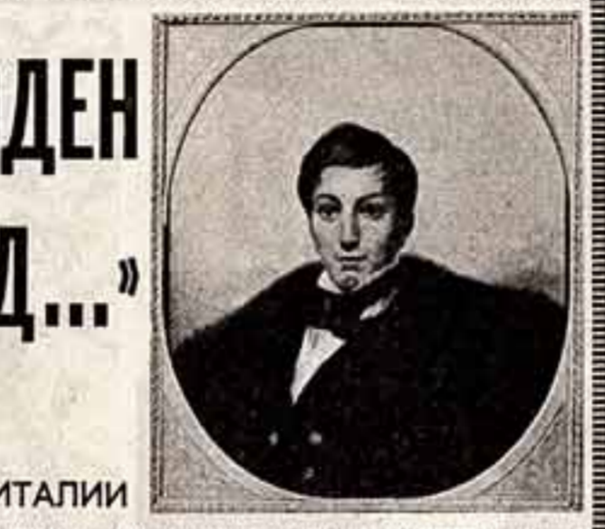
КИПРЕНСКИЙ В ИТАЛИИ