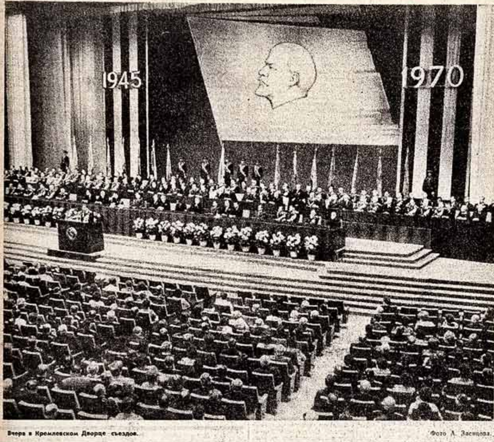
Вчера в Кремлевском Дворце съездов.