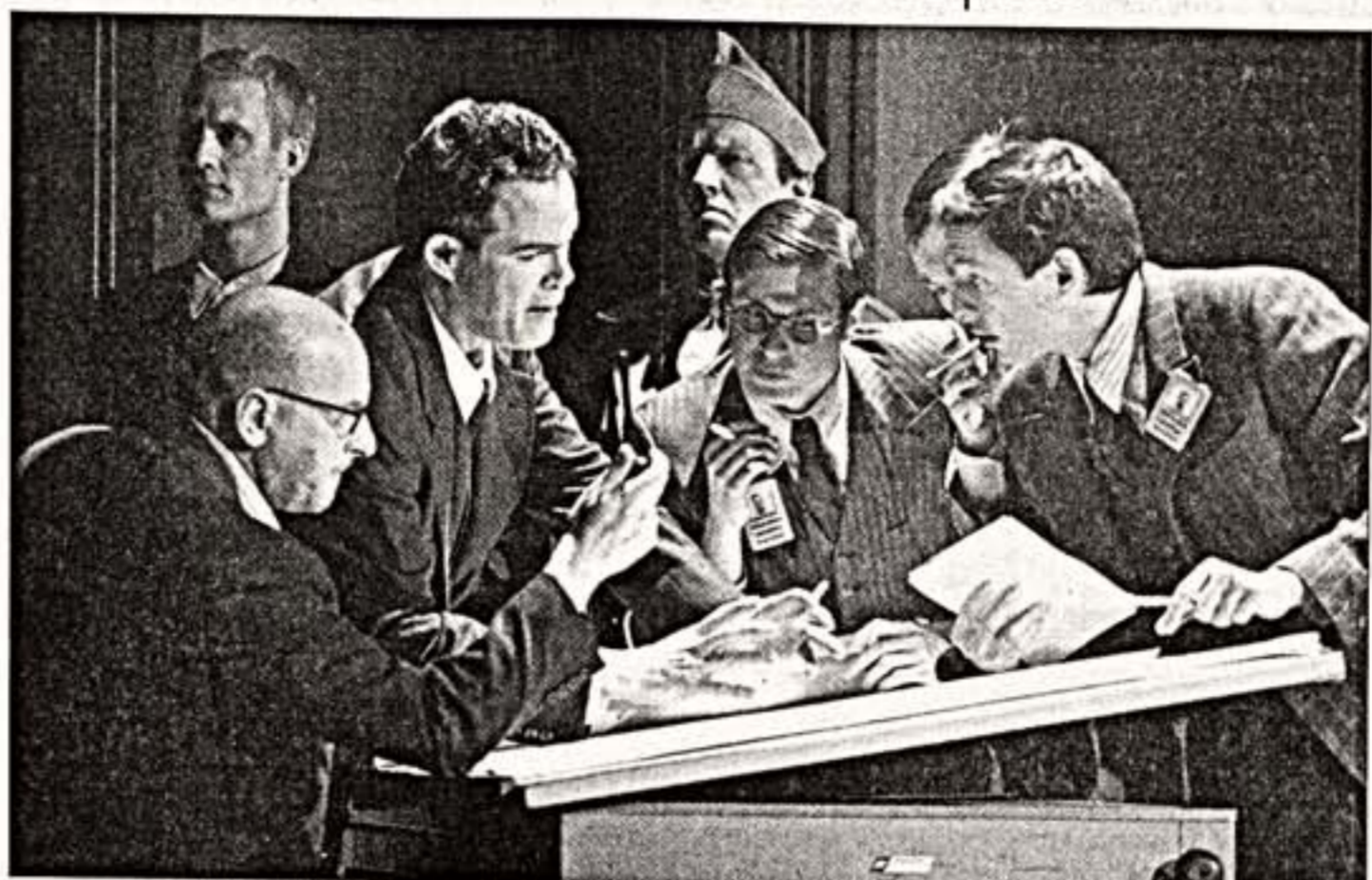
Лондон буквально помешался на Джеральде Финли. Взяв билет на премьеру...

"Опасные связи". Исторической сюжетом остаются театральные фонды, как бы задним планом, но на первый план выйдут люди, не очень симпатичные, но очень драматичные.