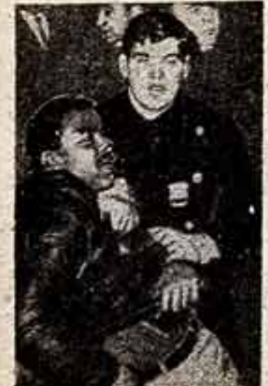
На улице американского города полиция чинит расправу над неграми.

Прямо из гетто негрятинского юношу отправляют во Вьетнам, где он должен защищать «свободу». Перед очередной наркотической операцией солдат читает листовку, написанную партизанами в дереву: «Солдат-негр! Ты совершаешь в Южном Вьетнаме такое же страшное преступление, каково индус-индус совершает против своей семьи у себя дома».