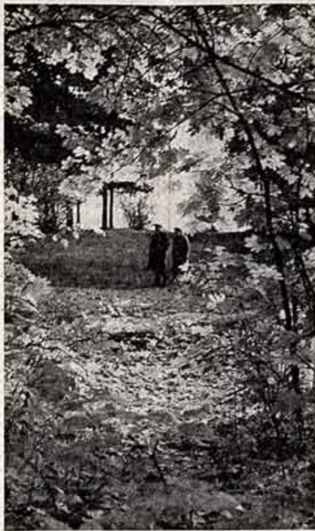
Ю. ГЕРАСИМОВ. «Осень в разгаре».

вышло полтора метра. Краевед насчитал около пятсот подобных следов, цолопки которых гнались в юго-западном направлении и скрывались под негладкими породами.