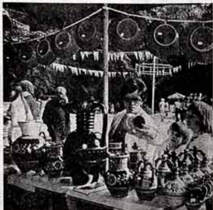
Эти искусные изделия советских народных умельцев демонстрировались недавно в шатерной галерее Ташкента...