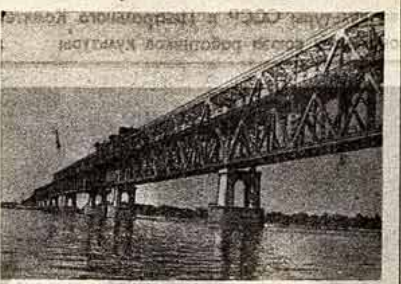
Кадр из болгарского фильма «Новая Болгария». Мост дружбы.

ЕСЛИ хотите увидеть, что могут сделать свободные люди на свободной земле, позвольте в Ропови — там буквально на пустом месте возникла фабрика и рудники, города и поселки; или побывайте в селлах Добруджа, где в новых просторных домах живут крестьяне, которые раньше не смеяли и мечтать о лишнем куске хлеба; пробейтесь по улицам первого социалистического города Димитровграда.