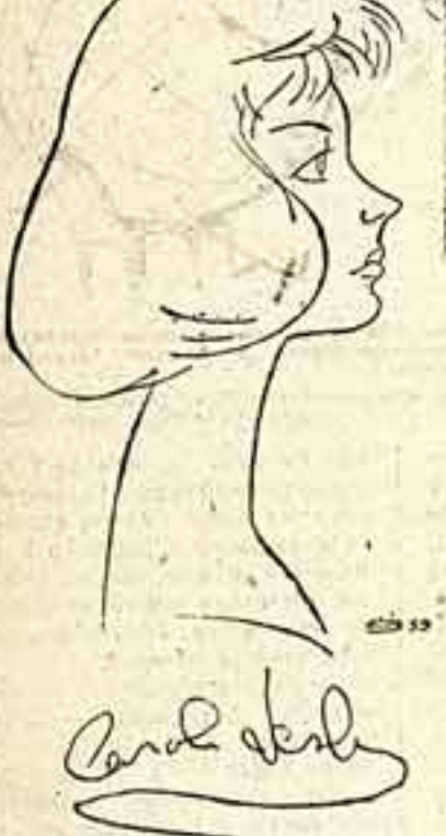
Французский режиссер Константин Жан.

«ЦВЕТ Туниса» — это название и образно и точно передает содержание цветного короткометражного фильма, представленного на конкурс фестивала делегацией Туниса. В форме легкой, свободной импровизации ведет режиссер Андре Бессис мирозаска о родной стране, которую африканское солнце щедро расцветило яркими красками. Белые улицы старого города буквально каждой как меняют тона освещения. Недаром сюда так стремятся влюбленные в цвет художники.