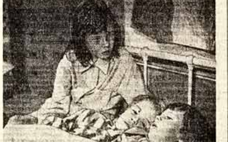
Кадр из английского фильма «Слезы сирот».

ЭТО произойдет 16 августа на московском стадионе «Динамо». Варшавские мастера, дворовойки на темы различных фильмов, достав на спортивную арену прославленных мастеров советского кино. Действие развлекательное и познавательное. Порой эта форма хорошо передает разнообразное течение жизни деревни, но иногда