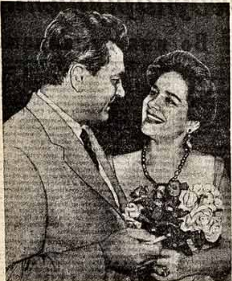
В дни фестиваля. Минская киноактриса Р. Кинтана и народный артист СССР С. Бондарчук.