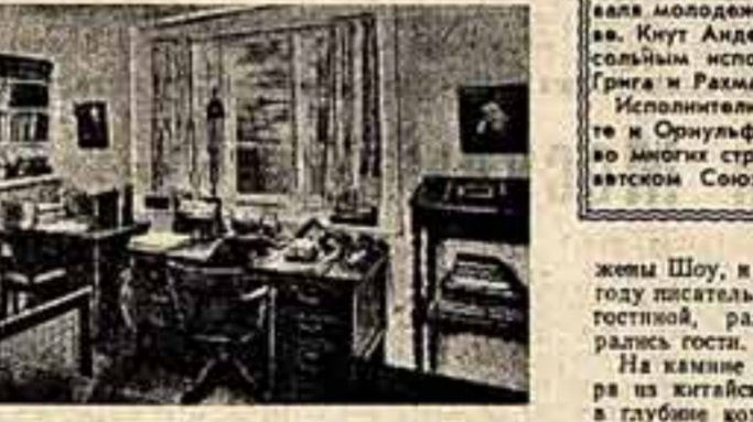
Рабочий кабинет писателя в «Уголке Шоу».