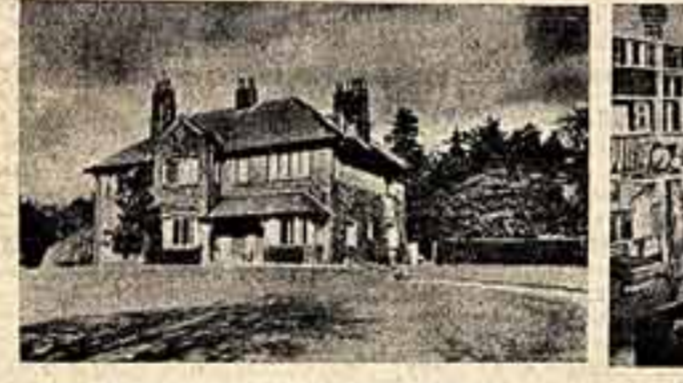
Дом Бернарда Шоу в Абот Сент Лоуренсе.