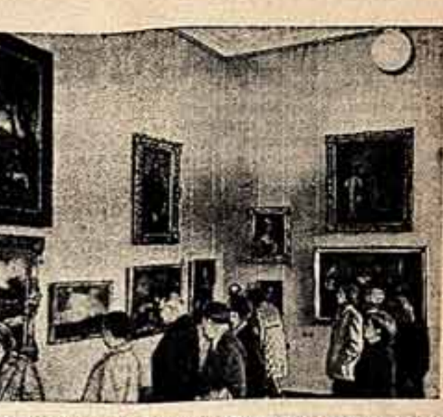
В 15 залах Государственного Эрмитажа в Ленинграде открыта выставка польского изобразительного искусства. На снимке: в одном из залов.