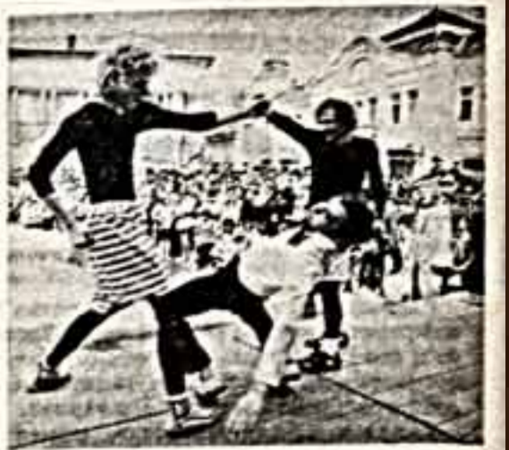
Во время гастрелей в Умзороде артистка театр «Лидеда» из Ленинграда сошла с жемчужной диадемой — она была украшением представления. Подсветка стала ярче и площадь времени возросла.