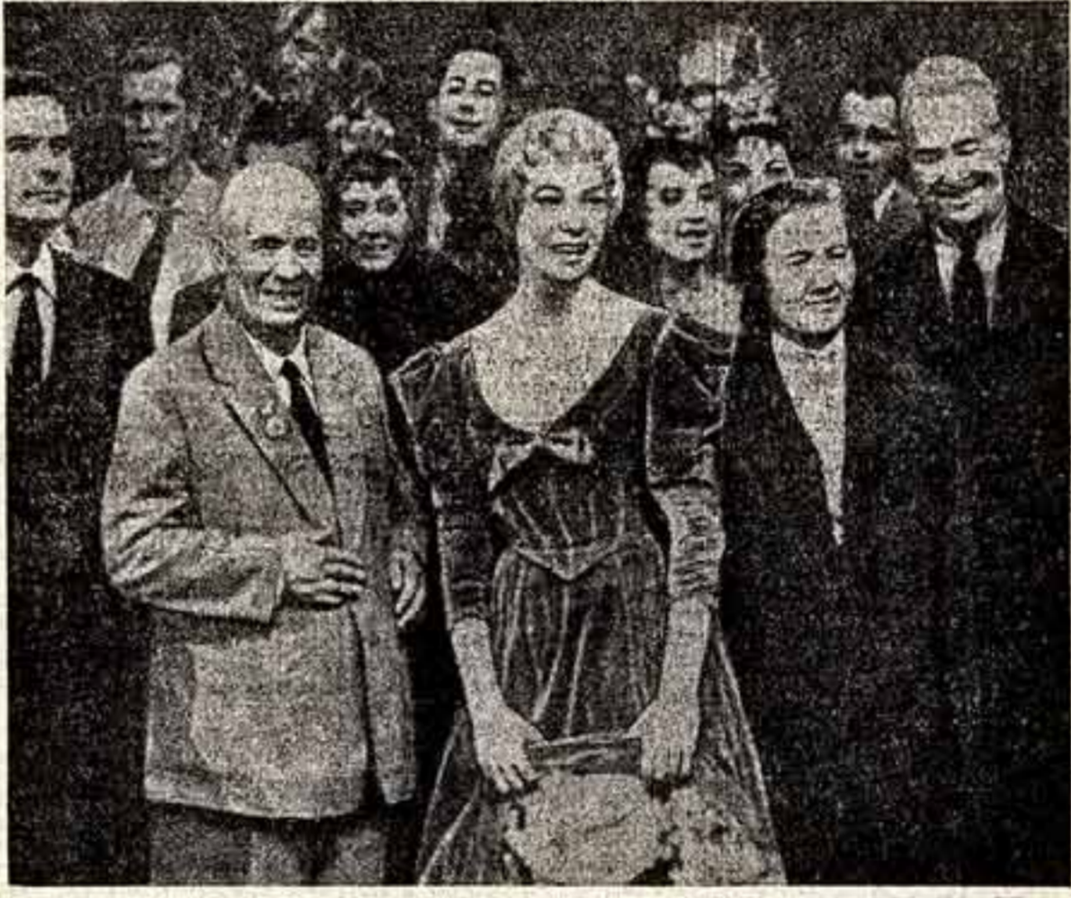
Н. С. Хрущев и Н. П. Хрущев в киностудии «Твентис сенчури-Фокс» в Голливуде.

Но я считал бы необходимым высказать по этому поводу одно «но». И это «но» заключается в том, что (Окончание на 2-й стр.).