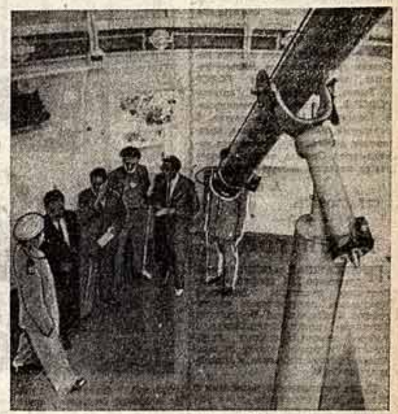
«Великая победа советской науки» — так называется специальный выпуск кинохроники, снятый операторами Центральной студии документальных фильмов...