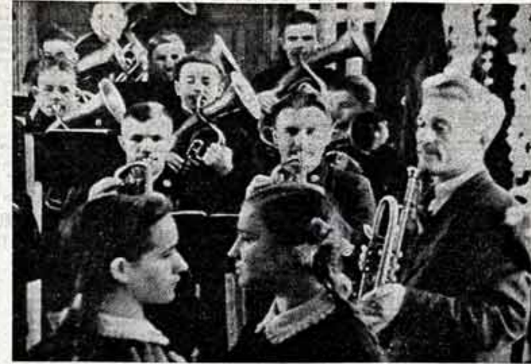
Ему была оказана честь участвовать во Всемирном фестивале молодежи и студентов в Москве.

Военно-патриотический клуб «Сын Героя» при Саратовском дворце культуры «Россия» улачено собирает материалы, связанные с жизнью и деятельностью своих именитых земляков.