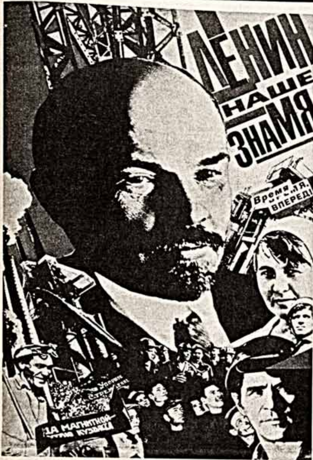
М. АББАКУМОВ, О. ВОЛКОВ. Ленин — наше знамя. (С Веселозной художественной мастерской «Страна Советов».)