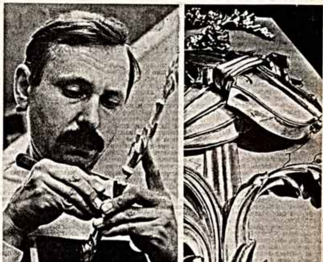
Продолжает работу по реставрации Останкинского архитектурно-художественного ансамбля конца XVIII века. Программа восстановления этого уникального памятника рассчитана до 1995 года.