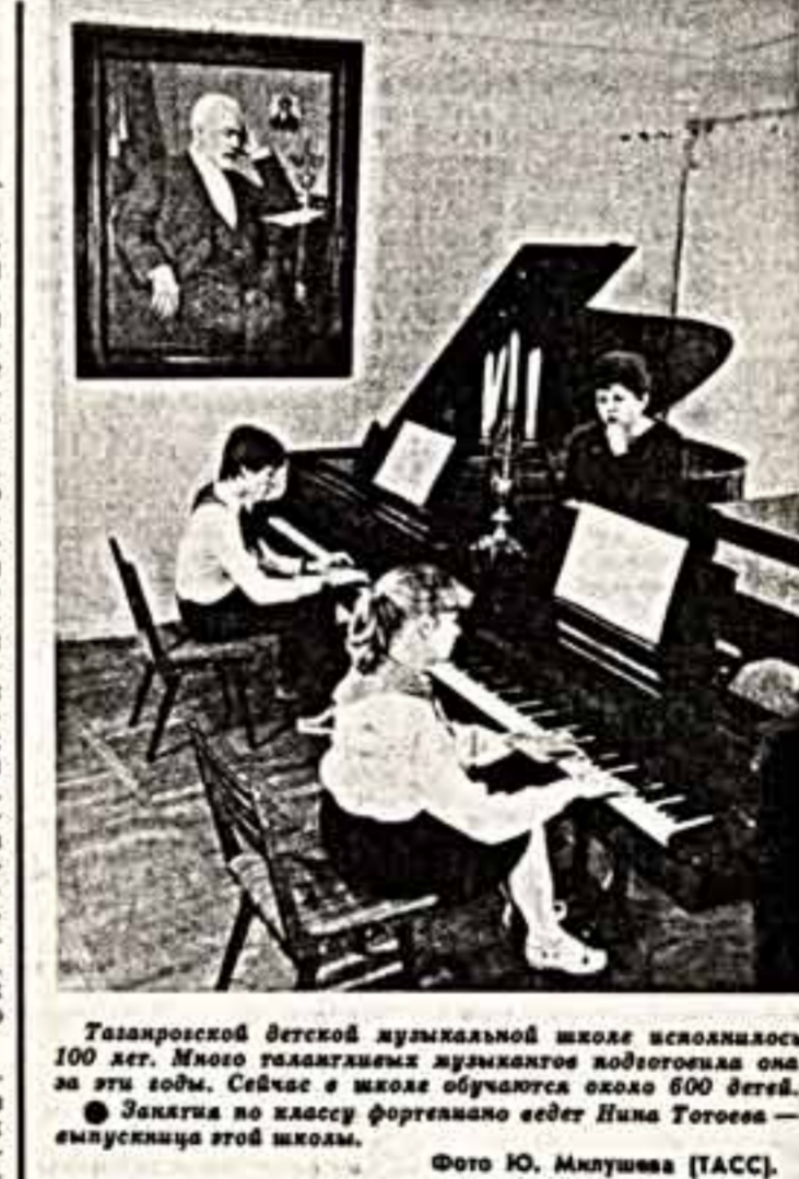
Талантливый летчик музыкального школы исполнилось 100 лет. Много талантливых музыкантов подготовила она за эти годы. Сейчас в школе обучается около 600 детей.