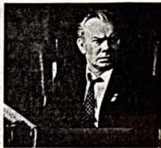
ИВАНОВО. Н. ТАРШИШ. Народный артист РСФСР Леон Раскатов.

Неповторимы пути, ведущие человека к искусству. Эту истину подтверждает и судьба Льва Раскатова, актера Ивановского драматического театра.