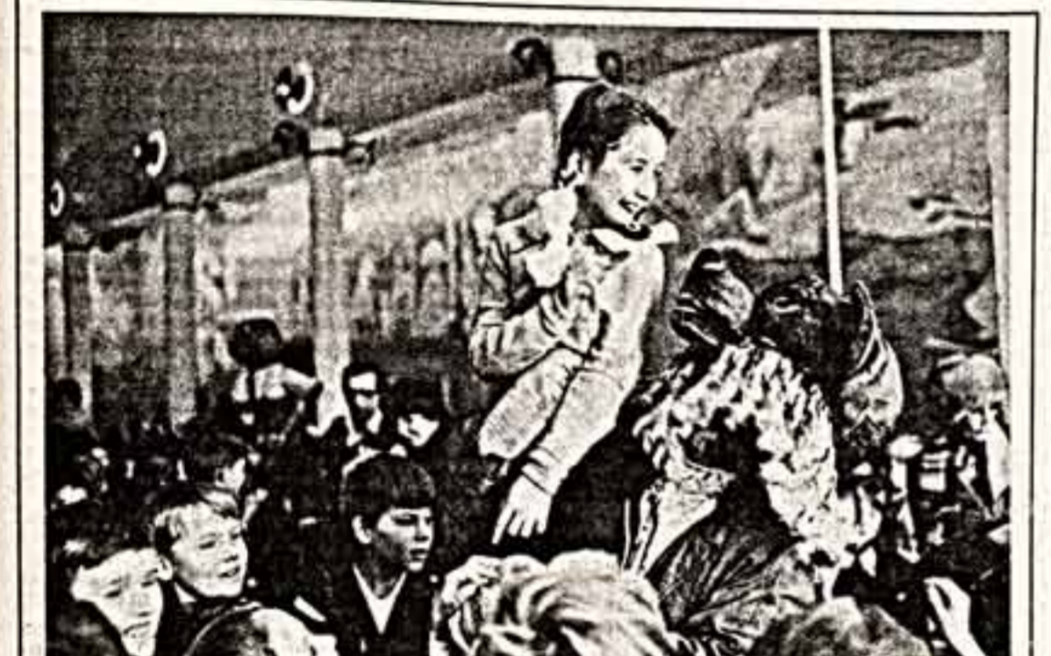
«Прежде несколько контрольных работ, еще нежного ушья, и прозенит последний звонок школьной коллодия. Что скрывает, жутко его мальчишки и девочки с интересом, потому что заглядывают на накануне Нового года, а там—кашмиры, элкс, новозданные, предостания, дошки, элкс, и, конечно, театры. На канунах юные зрители Уфы встретились с гитарным Петридой, примечательной принцессой, героини «Индийской легенды» и другими персонажами спектаклей Башкирского театра кукол.