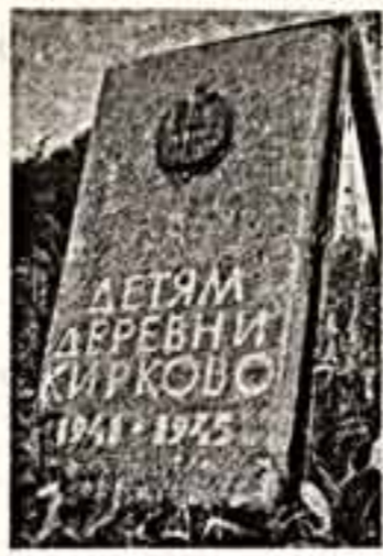
отгорода, кинили крышк. Рисовали, лепили и думали об одном в деревне Кириково дол...