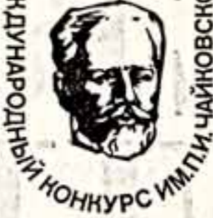
Международный конкурс имени Чайковского