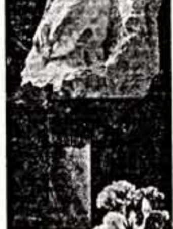
Образ великого поэта принадлежит Думану...