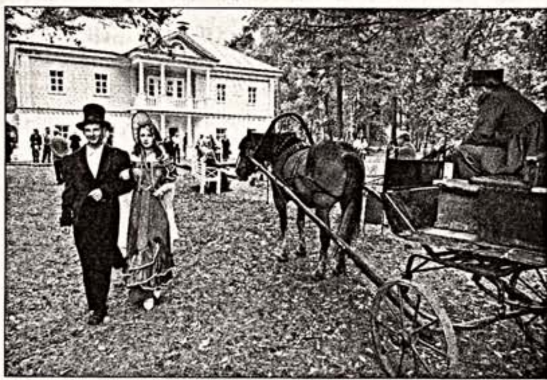
В музейно-заповеднике "Болдино"