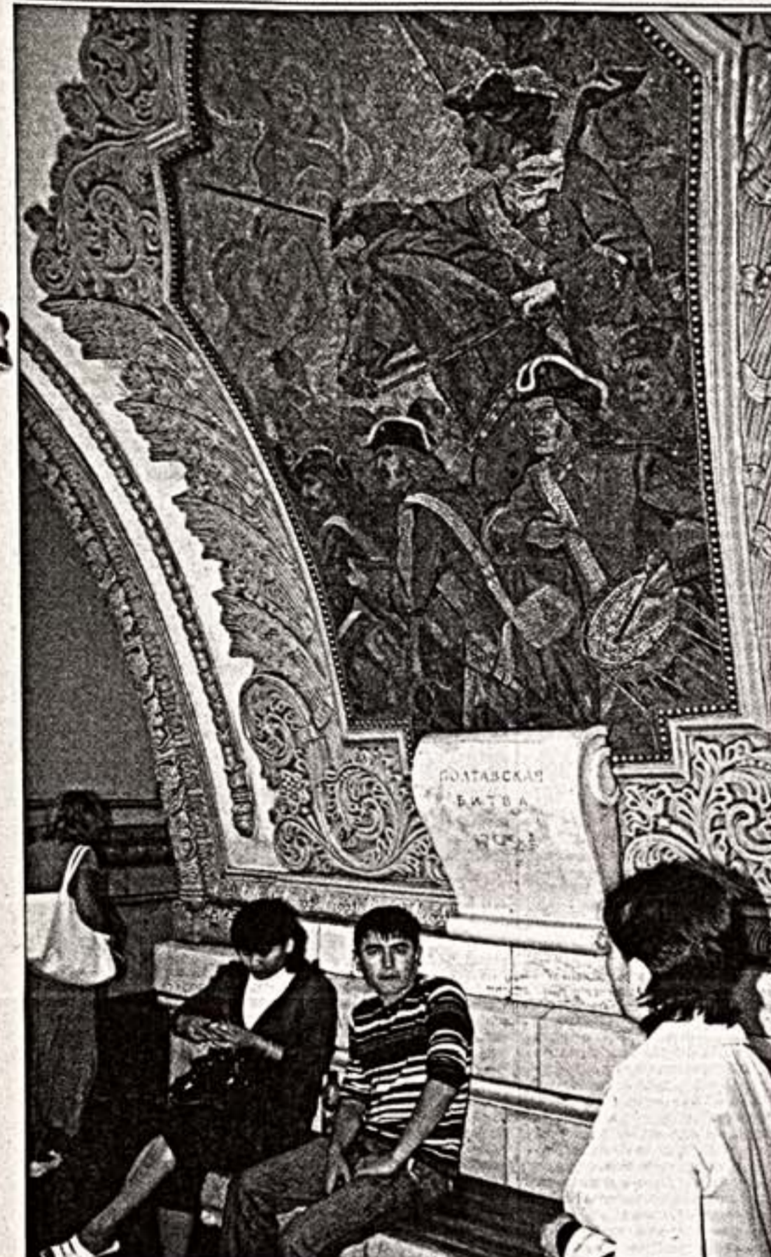
История битвы увековечена даже в метрополитене Москвы.

В череде событий, посвященных 300-летию Полтавской битвы, в Государственном Историческом музее прошел семинар. Его целью было осветить современное состояние исторической науки на события петровской эпохи. Любопытно, что сегодня сохранилось более полковника русских (до 25 лет) отбитых пугачевцев, кто против короля воевал при Полтаве. В ответ на молодых полководцев Петра Великого в числе полководцев названы и Кутузов, и Суворов, и победители они и немцы, и англичане. Обязательности ради добавим, и в том, что русские победы, не сомневаясь никто из представителей российской молодежи. Впрочем, историческое значение события, происшедшего на территории нынешнего пригорода украинской Полтавы, отрицать невозможно.