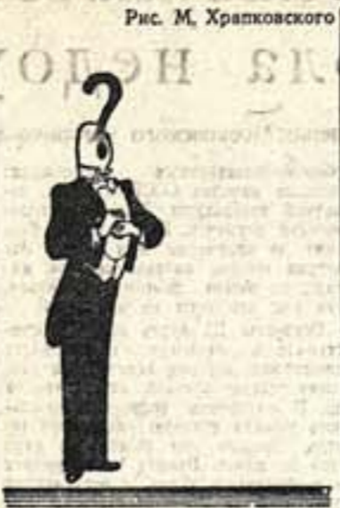
Рис. М. Храпковского