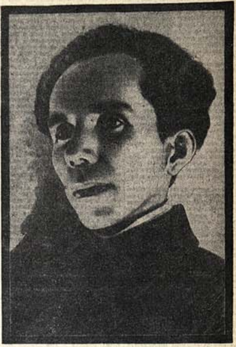
Николай Алексеевич ОСТРОВСКИЙ

22 декабря, в 10 часов 50 минут, в Москве скончался писатель-орденоносец Николай Алексеевич Островский. Он оставил после себя замечательное произведение — роман «Как закалялась сталь», который является образцом для всех советских писателей.