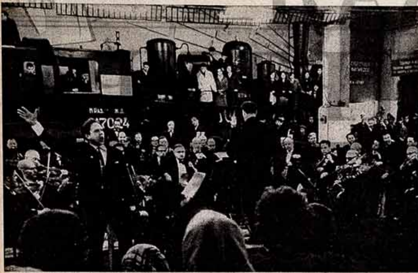
И. КОШЕЛЬКОВ. «Нам не так страшно жить...» (Концерт народного артиста РСФСР А. Залозного в деле Москва-Сортпункта).