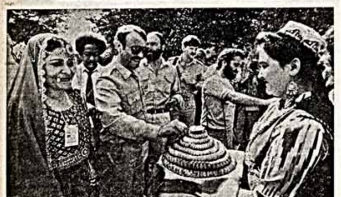
Хлеб-соль на узбекской земле. (Встреча студентов Ташкента с участниками фестиваля).