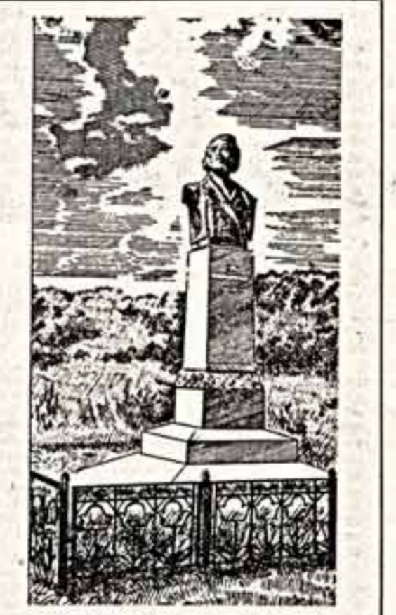
И 175-летию со дня рождения В. Г. Беллинского художник Виктор Омельченко создал серию рисунков «На Павловской земле». Окрестности города Беллинского. ● Дом-музей. ● Беседка в саду. ● Памятник В. Г. Беллинскому.