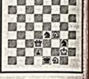
Мат в 2 хода

Отступление от принятого нами ограничения мысли фигур, понятно — ведь это «шахматная задача». Его название «конкурс в конкурсе», ведь историческое возникло несколько месяцев назад во Дворце культуры МГУ, где проводился большой шахматный вечер в честь юбилея Перестройки. Интересный диалог возник там президент шахматной Федерации Бразилии Л. Луна и прославленный советский шахматист, бывший капитан сборной СССР А. Старостин. — Шахматы — это интеллектуальный футбол, — сказал бразилец. — Роднит оба вида спорта необходимость быстрой мысли, умения мгновенно принимать решения, — согласился Старостин.