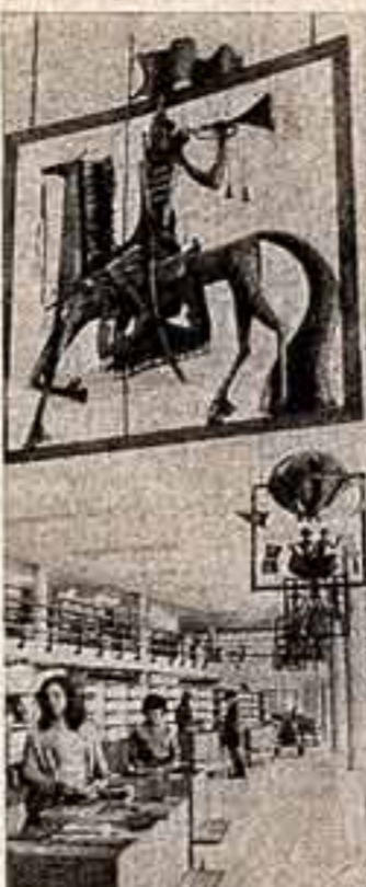
В Москве, на улице Большая Полянка, в музее Нового года открылся новый дом книги «Молодая гвардия».

Деревня нуждается в музыке, в музыкантах, Садья-Бонгер, Танди. Литературно-музыкальный вечер, вечер песни. Лекция-концерт. Мы делаемся без балластника, балластника, а нам предлагают «чистых» организаторов.