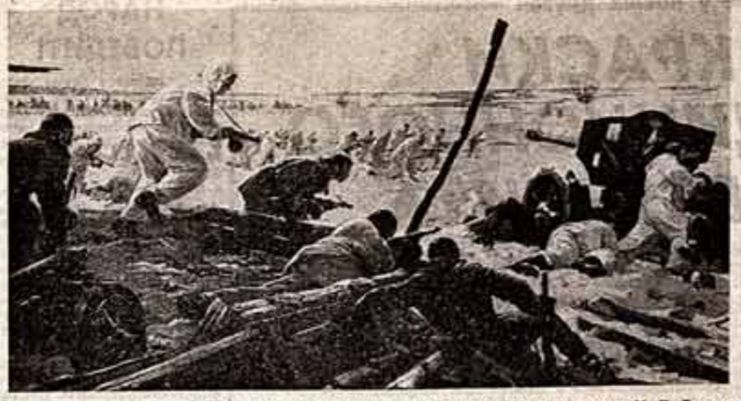
Диорама «Десант под Вязьмой», выполненная художниками Студии имени М. Б. Грекова П. Малюцким и Н. Присекиным. Фрагмент.