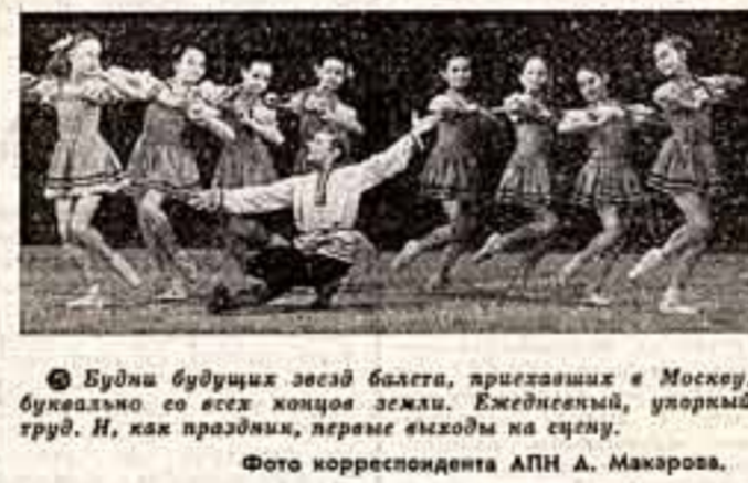
Будни будущих звезд балета, приехавших в Москву, буживали их еще юные зрители. Ежедневный, упорный труд. И, как праздник, первые выходы на сцену.