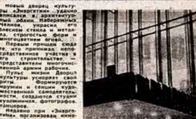
Новый дворец культуры «Энергетик» удачно вписался в архитектурный облик набережных Челнов, украсил его блеском стекла и металла, строгостью форм и многоцветием оград.