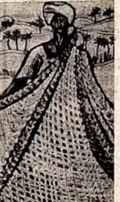
«Рыбак с сетью».

Труд и быт, природа страны — таковы содержание ее произведений. Всех их объединяет одна мысль: протест против несправедливости, социальное гнетение, борьба за национальное освобождение, социальный прогресс, мир на земле стали той основой, на которой складывалось творческое кредо художницы. Еще в юности занималась в Александрии руковожденной ее матерью художницей Махмудой Саид. Инжи принимала активное участие в общественном движении в 1945 году она избрана делегатом от своей страны на I Международной женской конгресс.