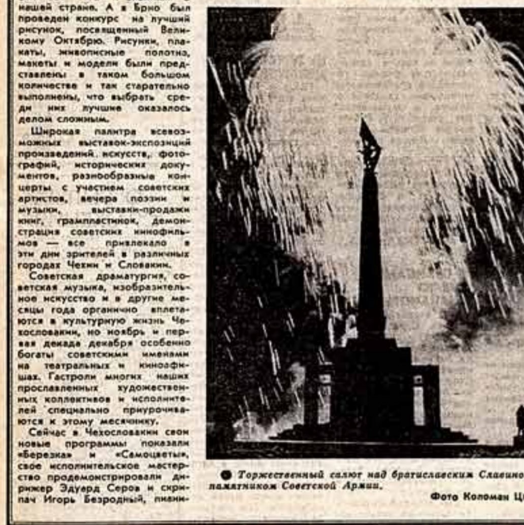
Торжественный салют над брагиславским Скаликом — ладьями Советской Армии.

Несколько купе и тамбуры вагонов Москва-Прага были загромождены богатой необычайной формой. Больше и меньше коры и шкни, прямые углы и квадратные, круглые и овальные, никак не походя на привычные дорожные чемоданы. Все стало ясно, как только двинулся поезд: из этих купе в сопровождении различных музыкальных инструментов. Нашим попутчикам оказались участники студенческого-молодежного ансамбля «Искатели», которые спешили на месячник чехословацко-советской дружбы.