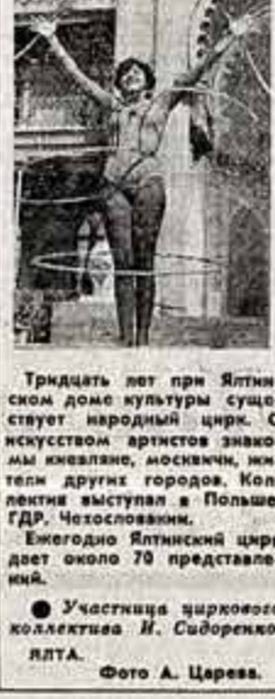
Тридцать лет при Ятлинском доме культуры существует народный цирк...