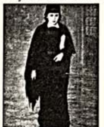
И. Репин. "Куростка", 1883 г. Верещагина, пейзаж Саврасова "Ранняя весна", пять великолепных Репина... Всего 57 живописных и 38 графических работ 32 ав-

Открытая в Центральном доме художника выставка "Золотой век русской живописи" – событие знаменательное. Если еще лет пять назад из Киева по пути или иным причинам нельзя было попасть ни на одного провинциала даже на самые эпихальные вернисажы, теперь творчество Врубеля, а теперь сам Музей русского искусства пожаловал в Москву и привез редчайшую коллекцию работ известных русских художников – Федотова, Тропинина, Айвазовского, Саврасова, Перова, Ярошенко, Репина, Шаинина, Врубеля, Васнецова, блистательных мастеров "Мира искусства" и "Бубнового валета", Шкловского – "На Севере диком" Шаинина, "Куростка" Ярошенко, "Три царя" подмороженного Шаинина, "Юристы" Ярошенко, "Три царя" подмороженного Шаинина, "Юристы" Ярошенко, "Три царя" подмороженного Шаинина, "Юристы" Ярошенко.