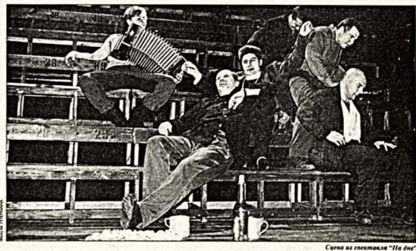
Сцена из спектакля "На дне"