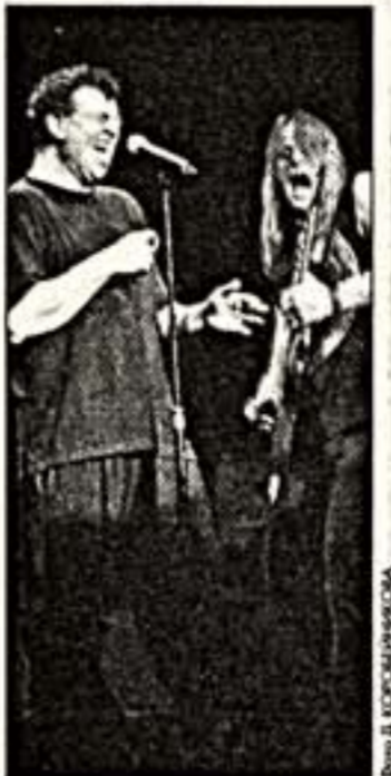
Выступает группа "Дип Перл"

В пурпурные цвета окрасилось в минувшее воскресенье Дворец спорта "Лужники". Однако наполнили главную ледовую арену страны отнюдь не спортивные болельщики.