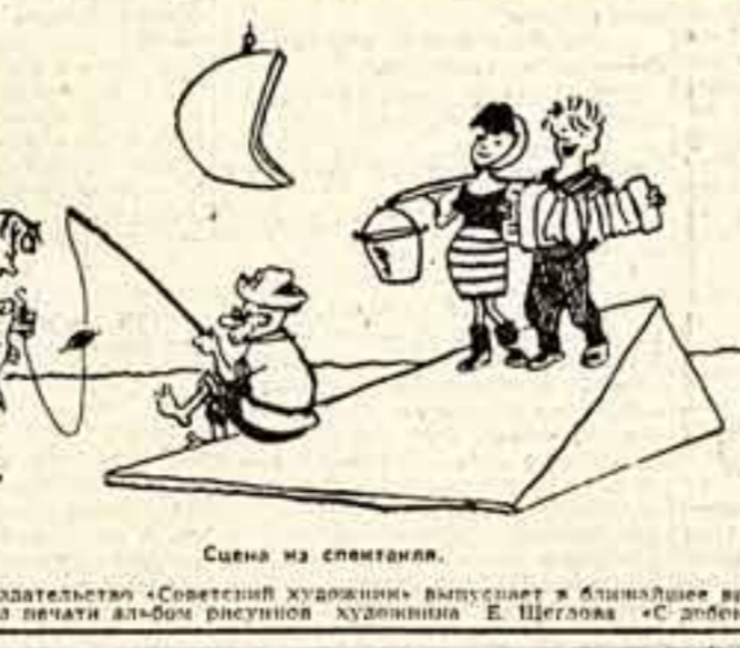
Сцена из спектакля.