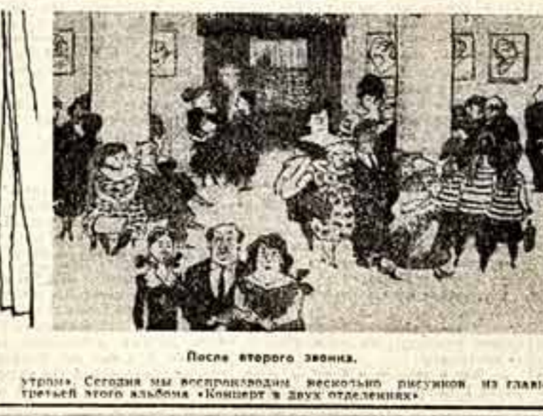
После второго звонка.