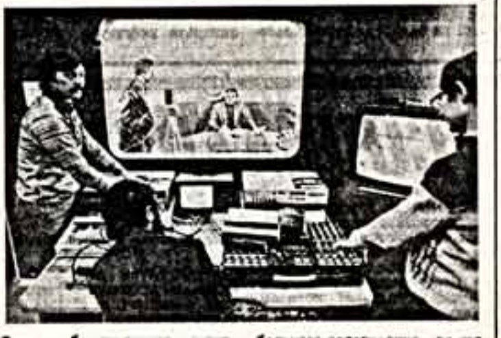
Видеолюбитель пользуется каналом ТВ после окончания передачи Центрального телевидения. Сейчас решается проблема большого телевидения для своего коллеса.

В первый день весны герой русских народных сказок Емеля приглашает всех в Сокольники на праздник народных игр. Лепта, бабки, рюкз, горелки — почти каждый знает названия этих веселых игр, а вот играть в них умеют далеко не все. И именно поэтому открылся секция обучения народных игр. А пока — праздник. Желающие могут познакомиться со старинной русской свадьбой, где будут и свадебные народные песни, и выкуп за невесту. Праздник продлится весь день, с соединяющей утри до девяти вечера. И закончится танцевальным балом. Н. ПРОСТОРОВА.