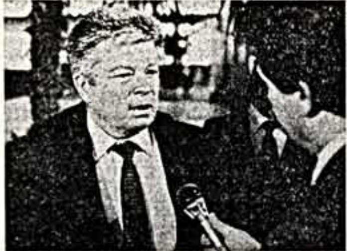
Интервью дает член-корреспондент Академии медицинских наук СССР С. Федоров.