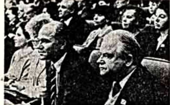
В зале заседаний. На переднем плане — народный артист Молдавской ССР Е. Дога и народный артист СССР Т. Хренникова.