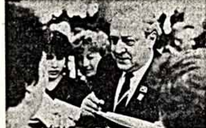
В первом ряду заседания народный артист СССР В. Стружельнич дает автографы.