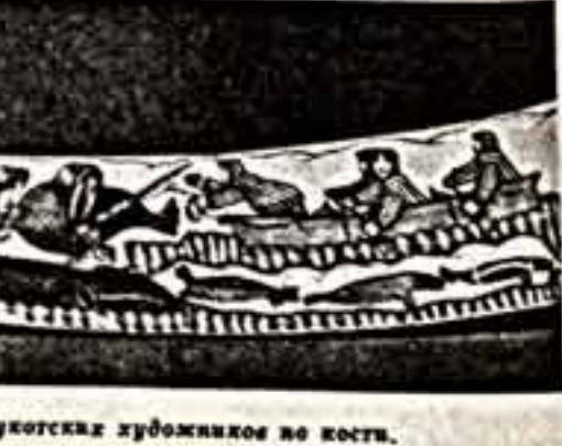
Гравюры чукотских художников во кости.