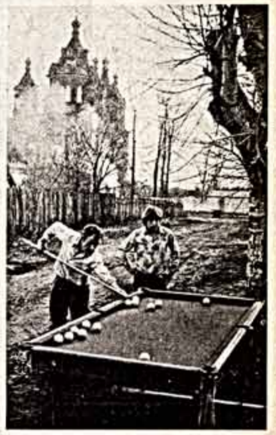
С. КУЗЮТКИН. «Когда в деревне клуб закрывали...»