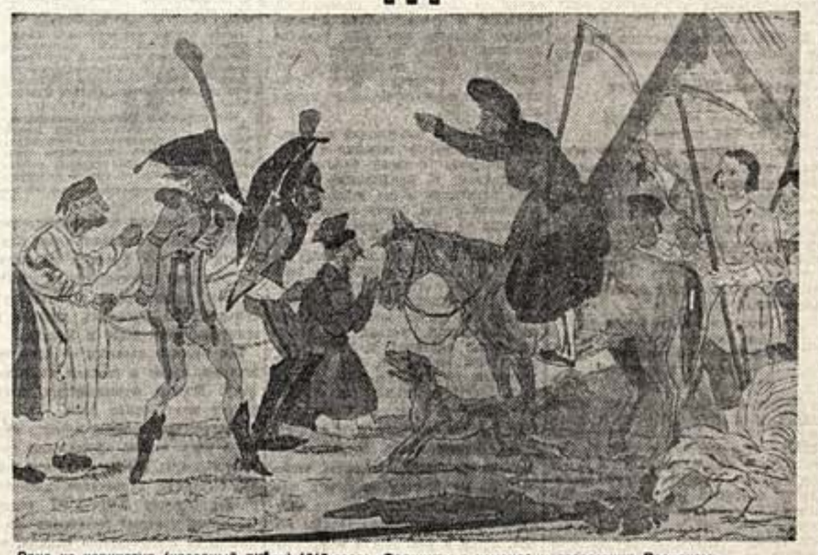
Одна из карикатур (народный пубок) 1812 года: «Француз в команде у старостины Василия».

Кругомов А. АЛЕКСАНДРОВ. Кругомов А. АЛЕКСАНДРОВ. Кругомов А. АЛЕКСАНДРОВ.