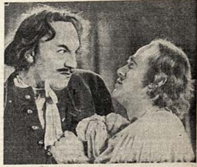
Кадр из фильма «Петр II». Симонов — Петр, Жаров — Меншиков.

В сентябре в Москве в Доме культуры откроется отчетная выставка работ участников поездки. На выставке будут показаны около 120 фотокартин и этюдов.