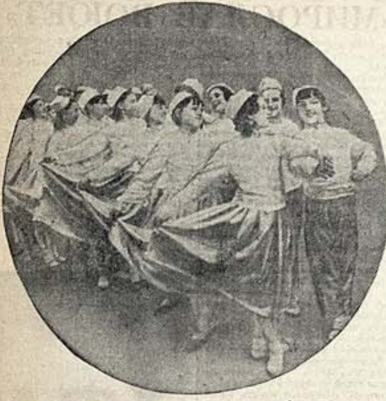
Копиона балетной студии куйбышевского «Дворца детей» на демонстрации.