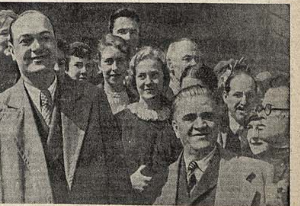
Возвращение в Москву Московского ордене Ленина Художественного академического театра СССР им. Горького. Народные артисты СССР ОФФ орденаносцы тт. Хмелев (справа) и Тарханов в группе встречавшим на Белорусском вокзале в Москве.

Мы были в Париже впервые. Мы были в Париже впервые. Мы были в Париже впервые. Мы были в Париже впервые.