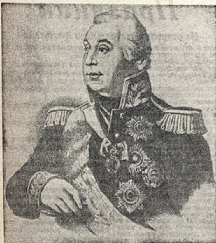
Кутузов. Портрет кисти Борина