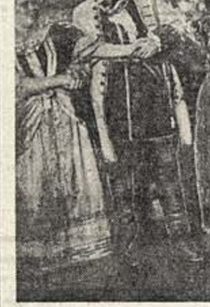
Кадр из фильма «Петр I». Ассамблея у Меншикова