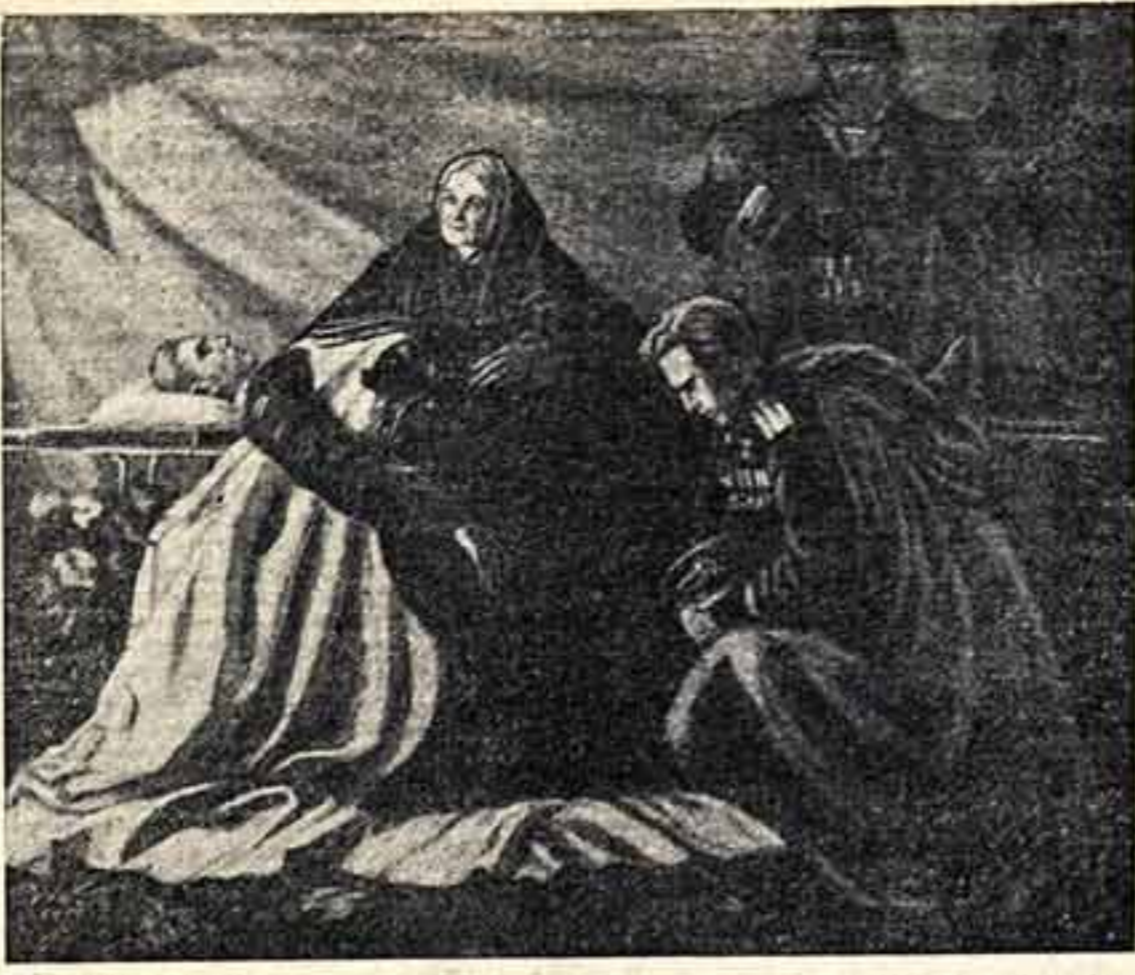
Слева — главный герой... Юбилей фелдоскинского промысла