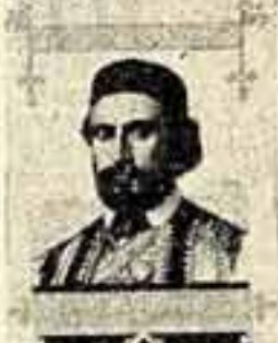
Фронтиспис к роману Петра Негоды «Горный венец» работы художника В. Носкова, гравировал Ф. Быков.