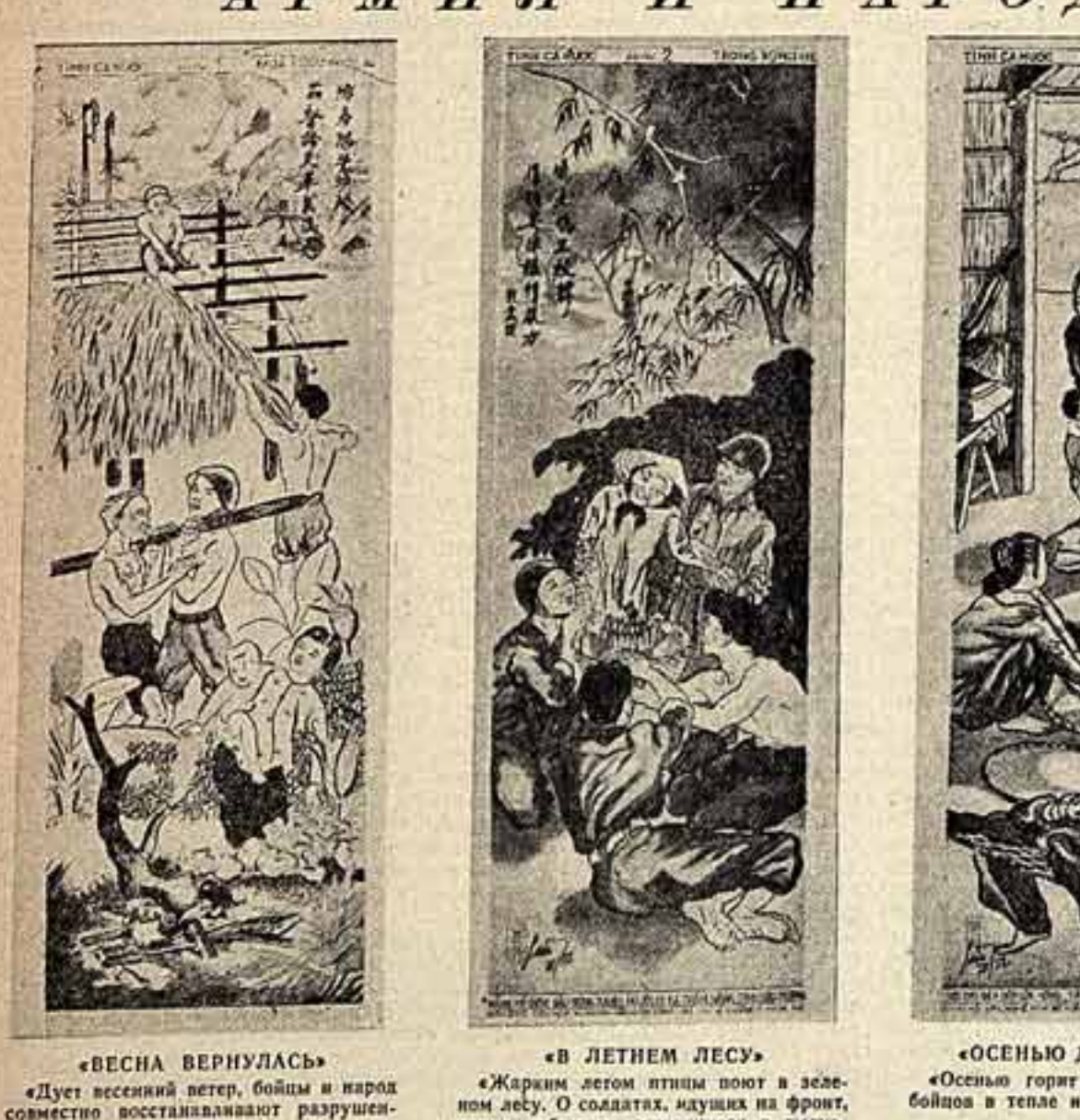
«ВЕСНА ВЕРНУЛАСЬ», «В ЛЕТНЕМ ЛЕСУ», «ОСЕНЬЮ ДЕТЯМ ТЕПЛО», «СБОР УРОЖАЯ ЗИМНЕЙ НОЧЬЮ»