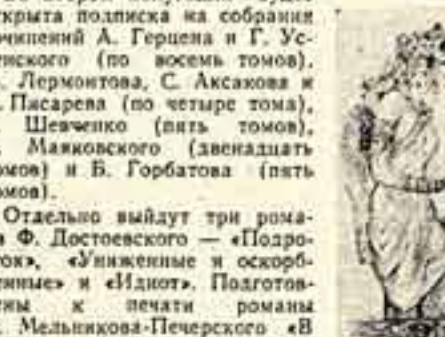
Художник Л. Фейнберг. Иллюстрации к «Индийским сказкам».

Первое заседание открыл президент США Д. Эйзенхауэр.