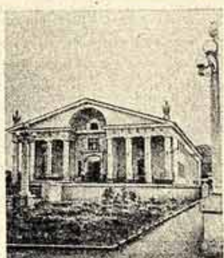
Чкаловская область. Благоустроенный молодецкой город металлургов Медногорск. Здесь построены новые кварталы жилых домов, магазины, клубы, кинотеатры. На снимке: новый кинотеатр «Урал» на 400 мест.

Можно не сомневаться в том, что на призыв Коммунистической партии развернуть борьбу за новый мощный подъем социалистической промышленности, за дальнейший технический прогресс советская интеллигенция ответит новыми патристическими делами, новыми творческими свершениями на благо Родины, на благо народа.