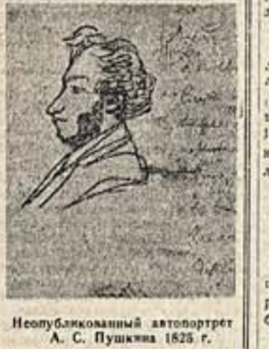
Неопубликованный автопортрет А. С. Пушкина 1825 г.