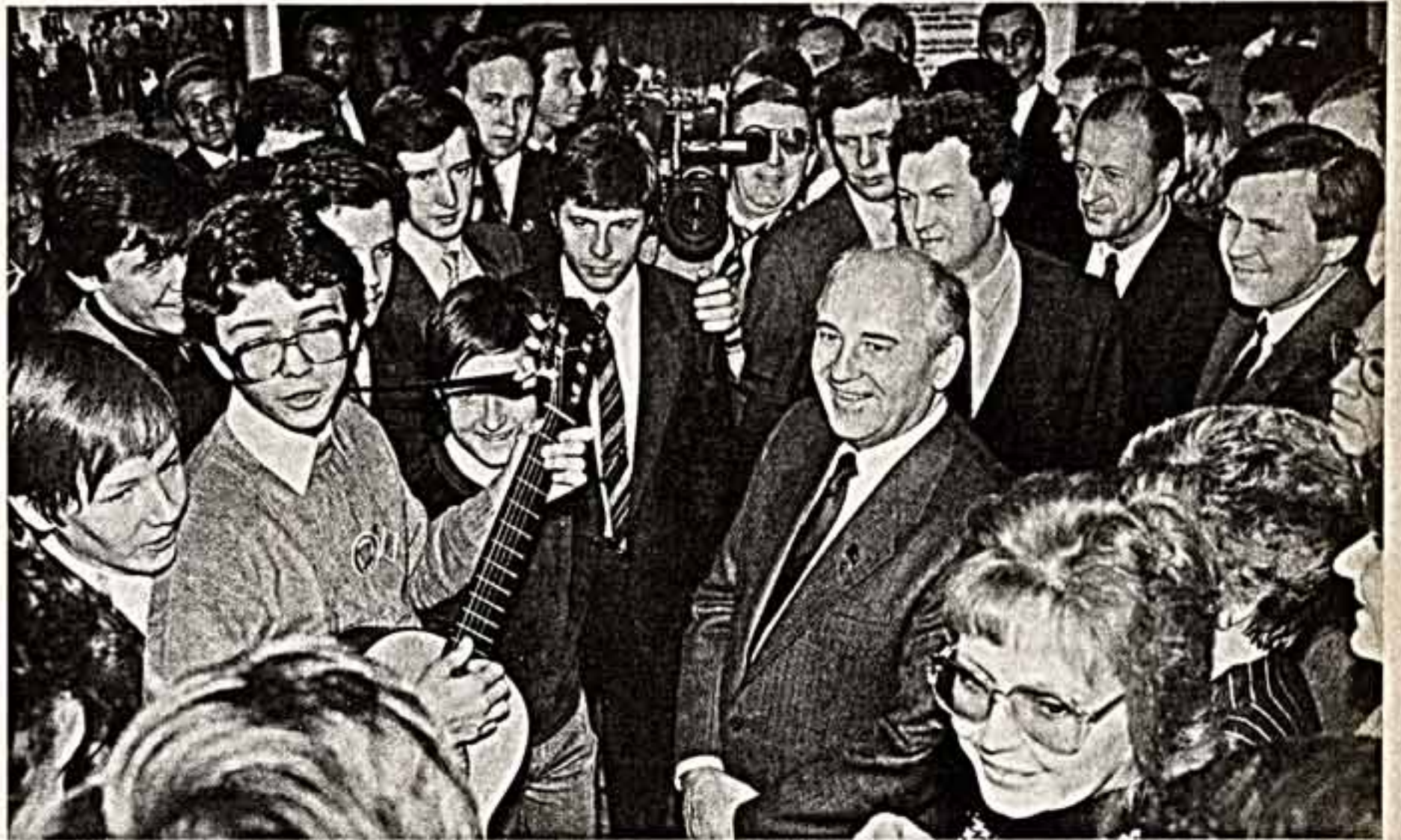
Во время встречи во Дворце молодежи.