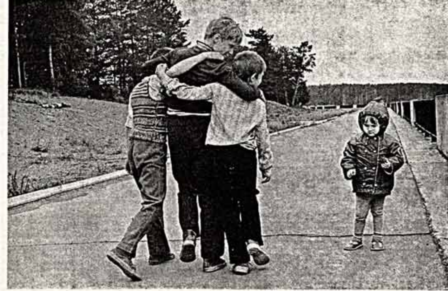
Ю. Федоров. «Ох уж это молодое поколение...»