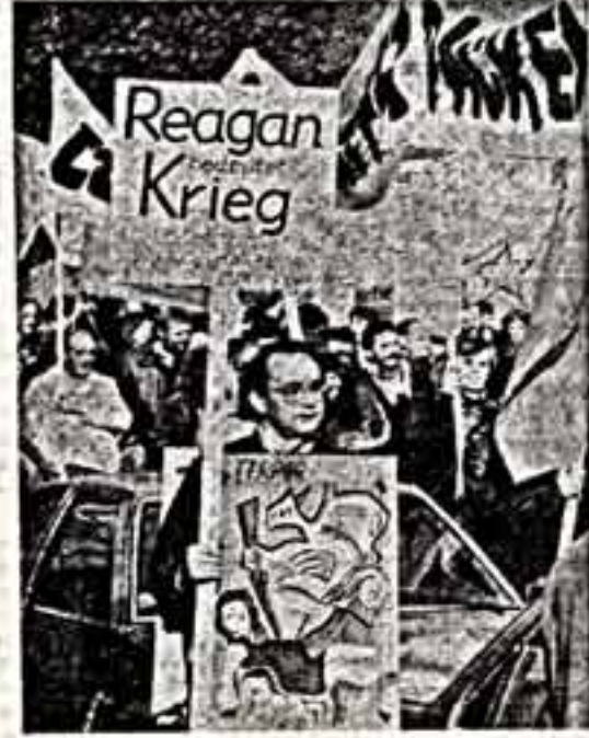
ТРУБАДУРЫ «ХОЛОДНОЙ ВОЙНЫ»

— Когда первый луч прожектора осветил Галину Уланову, зрители встретили великую балерину.