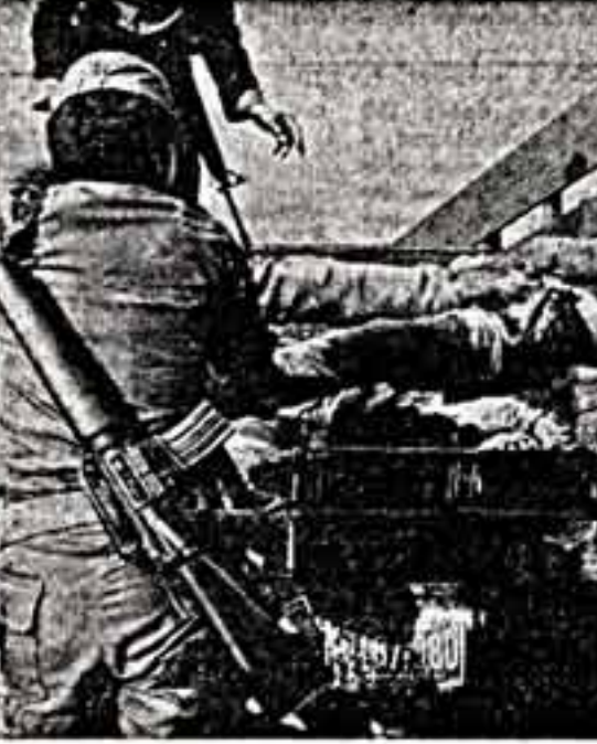
ТРУБАДУРЫ «ХОЛОДНОЙ ВОЙНЫ»