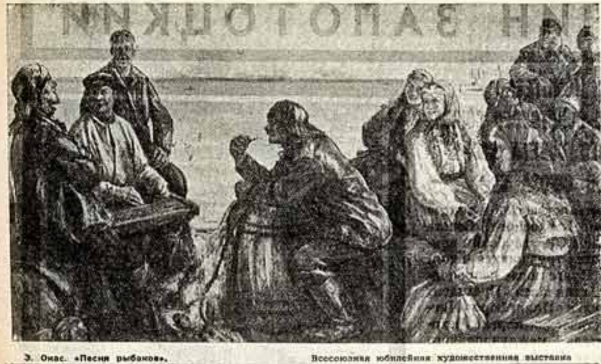
Э. Онас. «Песня рыбаков». Всесоюзная юбилейная художественная выставка